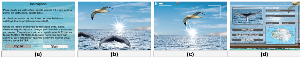
Fig. 2. Imagens do primeiro protótipo do jogo Expedição Antártica.

Após o planejamento e design , foi desenvolvido um protótipo de um minijogo de uma missão do jogo para ser avaliado pelo público-alvo. Para essa avaliação, o protótipo continha apenas uma missão do jogo, que consistia num processo de fotografar e catalogar uma cauda de baleia. Inicialmente, é apresentado ao jogador a tela de instruções (Figura 2-a), após selecionar o botão Jogar , se inicia a etapa de fotografar a baleia, onde o jogador tem uma visão frontal (em primeira pessoa) do mar, onde ele pode encontrar animações das caudas de baleia (Figura 2-b e Figura 2-c). Por fim, caso o jogador consiga fotografar a cauda corretamente, aparece o catálogo (neste protótipo, o catálogo é apenas uma imagem, sem nenhuma funcionalidade, vide Figura 2-d).