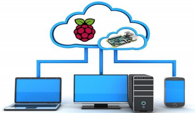
Figura 3. Sistema de resguardo en la nube (NAS)

Tras haber fincado las bases del NAS, procedemos a la configuración con un inicio de sesión en la frontend web, todo esto se llevara a cabo con un computador distinto, pero que este dentro de la misma red, posteriormente a esto, ingresamos a nuestro navegador con la dirección IP que el router asigno a la Raspberry con NAS, ulteriormente ingresaremos con el usuario que pusimos anteriormente y nuestra contraseña, una vez obtenido acceso abriremos las utilidades de OpenMediaVault en las cuales ajustaremos los que es la hora y fecha correspondiente.