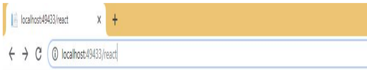
Figura 2. Host

Para crear el host (Figura 2) y levantar el servidor se realizó desde Visual studio web, en ella se hizo la programación donde se creó una ruta, así como su dominio de sitio es decir su URL por sus siglas en ingles un (Localizador Uniforme de recursos).