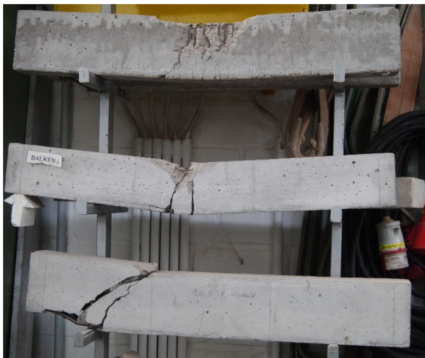
Abbildung 5: Abgedrückte Betonbalken am Institut für Materialprüfung (Jade HS)

Die Methode hat viel Potenzial. Allein in der Jade Hochschule im Fachgebiet Bauwesen Geoinformation Gesundheitstechnologie (BGG) gibt es hunderte von Exponaten die idealerweise in digitaler Form genutzt werden könnten. Eine physische Referenz kann darüber hinaus ebenfalls genutzt werden um eventuelle Funktionalitäten vorzuführen. Der Studiengang des Bauingenieurwesens vermittelt beispielsweise neuen Studenten die Berechnung der Versagenszustände im Stahlbeton. Ergänzend dazu werden Exponate mit unterschiedlichen Versagensformen im Institut für Materialprüfung (IfM) vorgehalten (vgl. Abb.5).