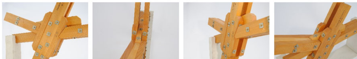
Abbildung 2: Auszug einer Bildserie – Zweigelenk-Rahmenecke