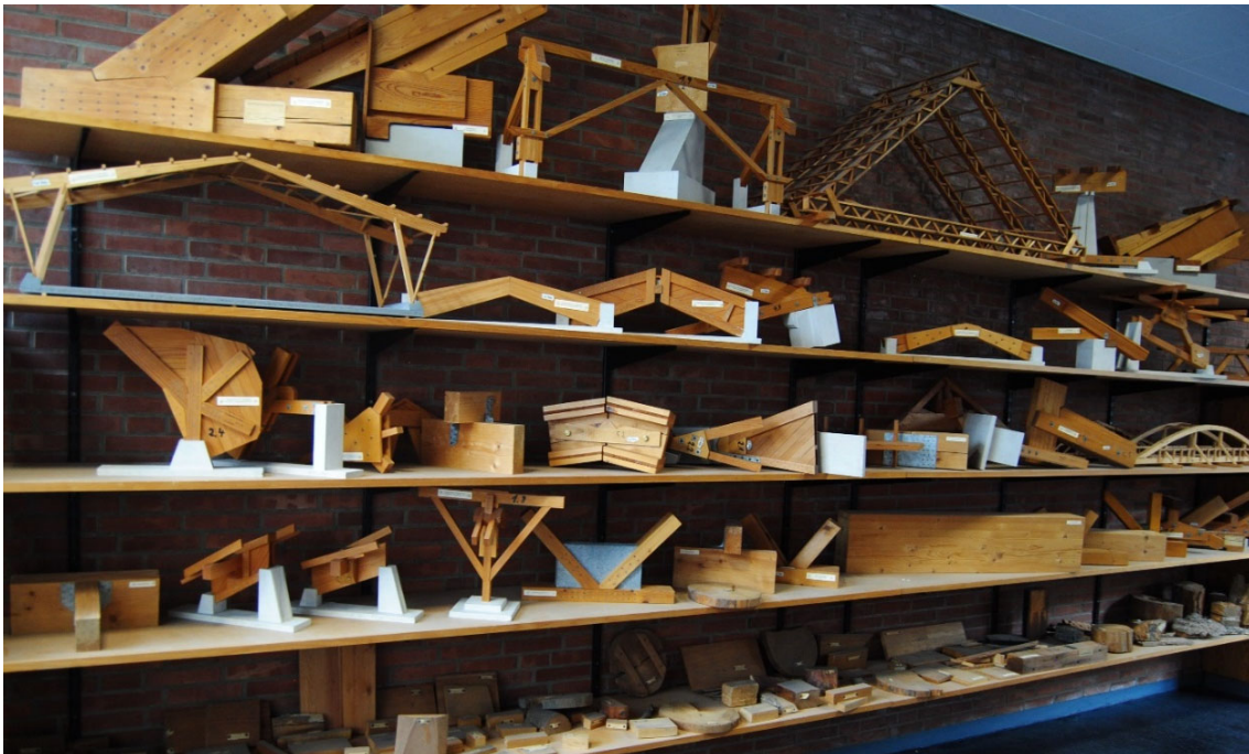
Abbildung 1: Holzbauexponate an der Jade HS

In der technischen Ausbildung ist es hilfreich sich Konstruktionen und dessen Ausführung mit einem Exponat zu verdeutlichen, um Details zu erklären. Über die letzten Jahre haben die Professoren der Jade Hochschule in allen Bereichen einiges an Exponaten zusammengetragen, mit deren Hilfe praxisnahe Materialien und konstruktive Verbindungen, wie beispielsweise in Abb.1 dargestellt, in den Vorlesungen vermittelt werden.