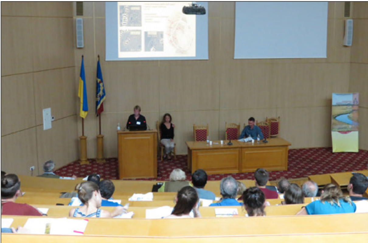
September 15 th , 2017. Plenary session in the Red Building of Taras Shevchenko National University of Kyiv