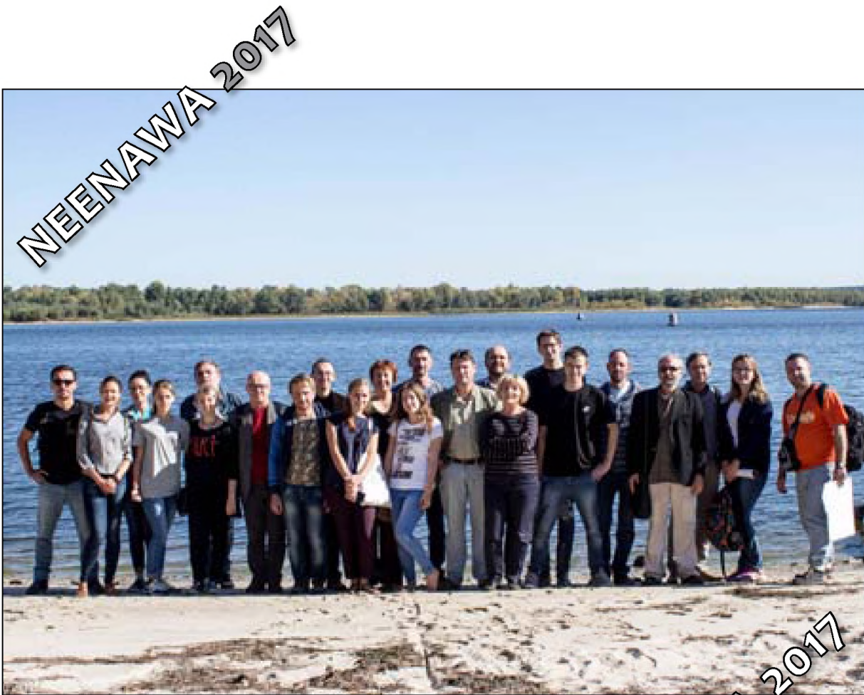
On the Dnieper River bank