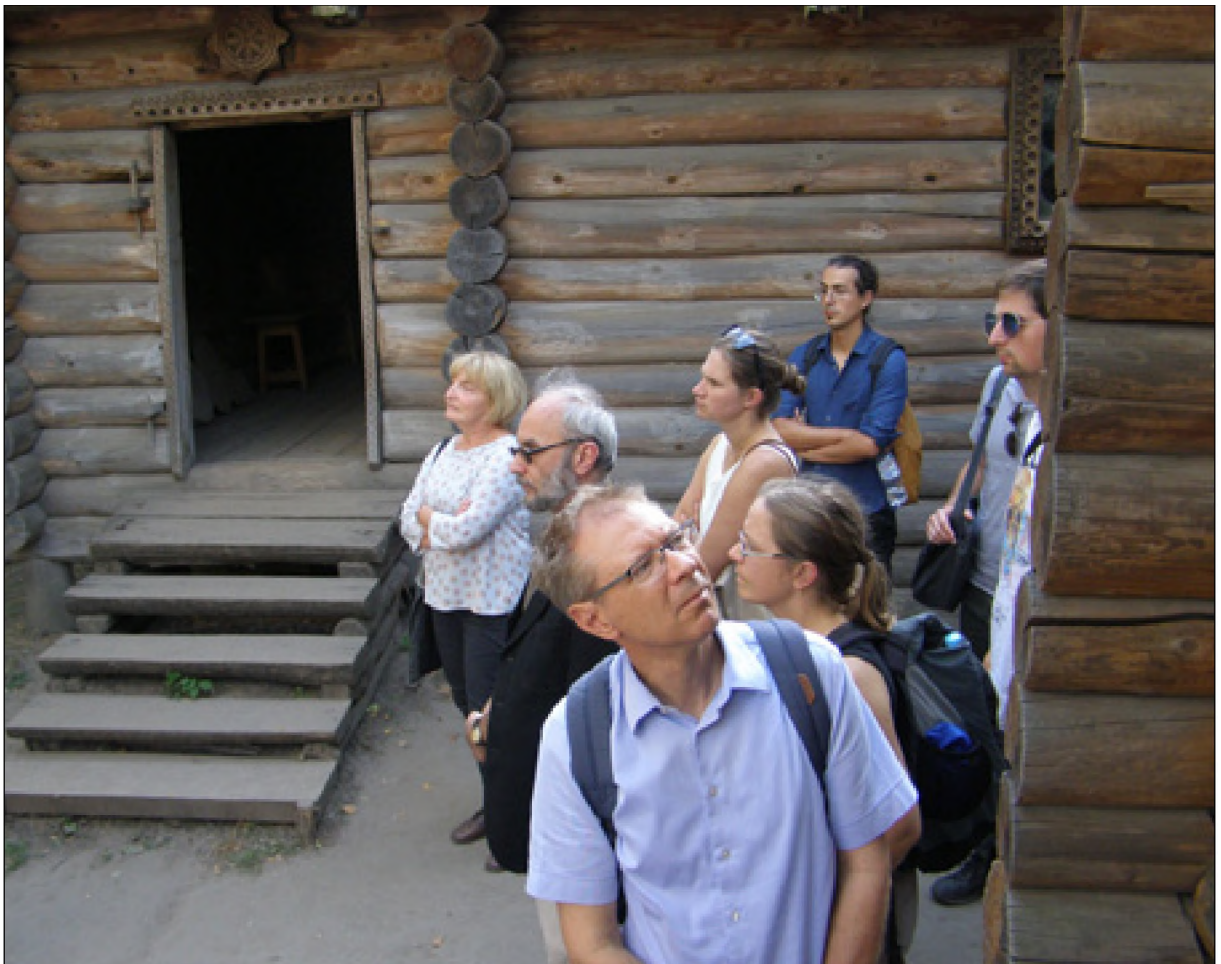
Participants of the conference during excursion in Preserve "Pereyaslav"