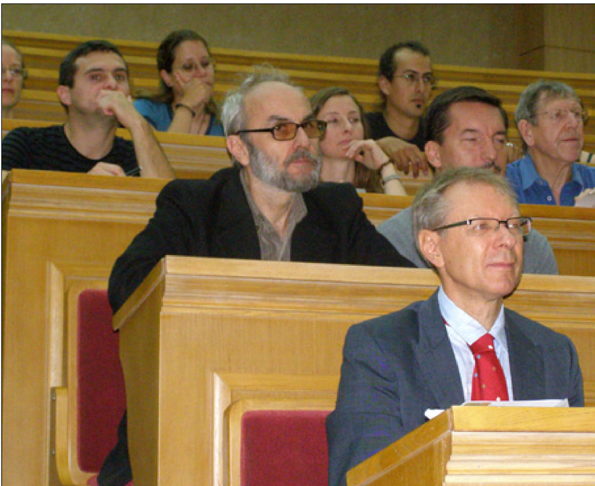
Participants from Macedonia and Switzerland at the Plenary session