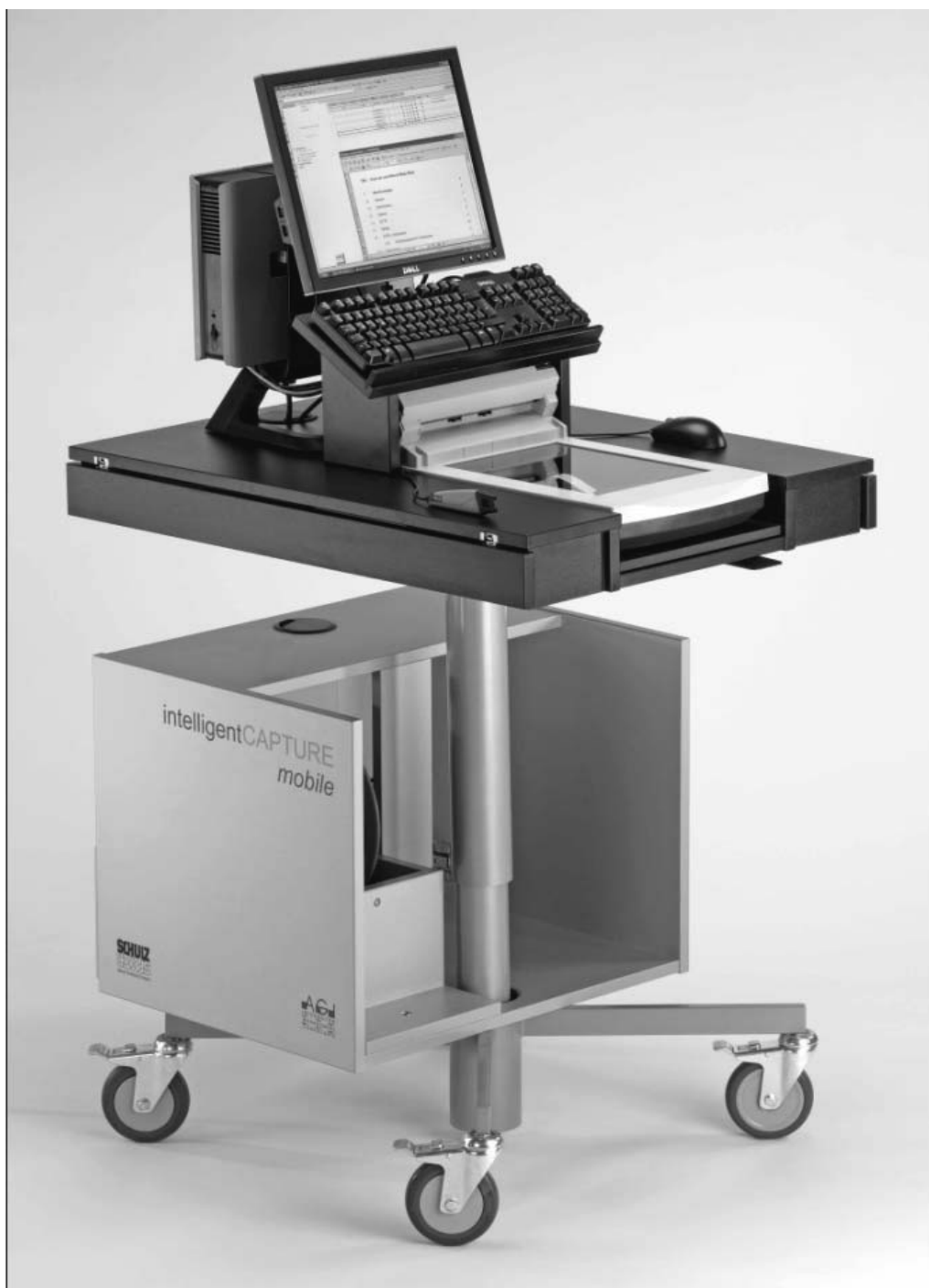
Abbildung 3: intelligentCAPTURE mobile wird direkt zwischen engen Regalen eingesetzt. Der Scanner fährt zum Buch, die hohen Medientransportkosten werden stark minimiert. Über WLAN kommuniziert die Scanstation mit dem Bibliothekssystem, dandelon.com, dem Domino-Server und dem Internet. Die Mitarbeiter kommunizieren über Chat, IP-Telefonie, Application Sharing und eMail mit der Projektleitung. Vom Einsatz gibt es ein Video auf der AGI-Homepage.

eigenen Nutzen. Staatliche Förderung von EU oder BMBF wurde bis heute verwehrt.