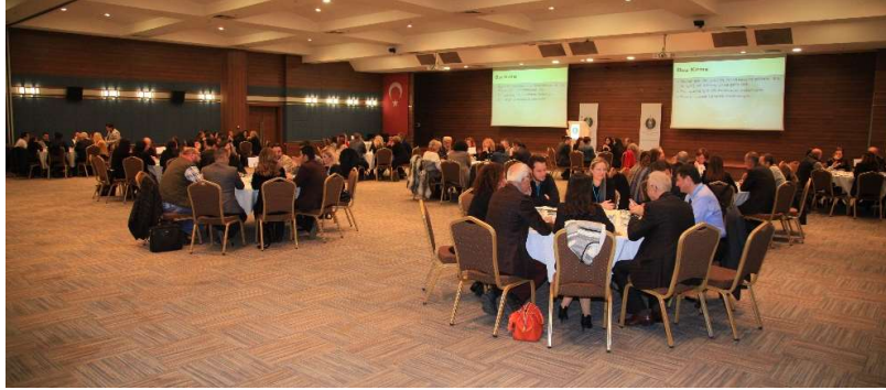
Şekil 3: Katılımcılardan görünüm