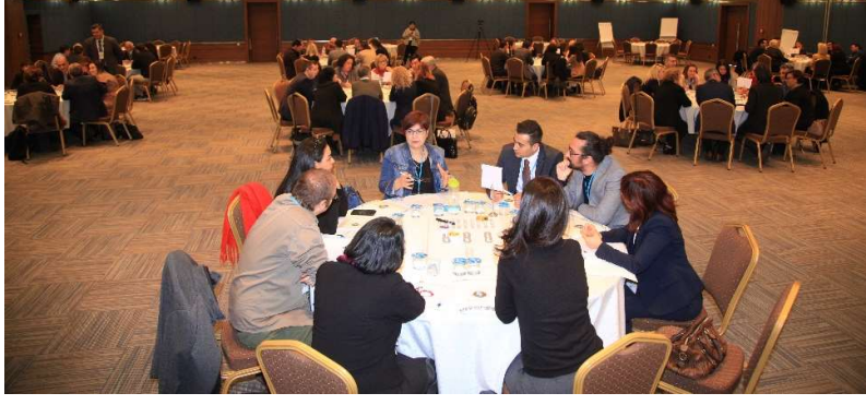
Şekil 1: Katılımcılardan görünüm