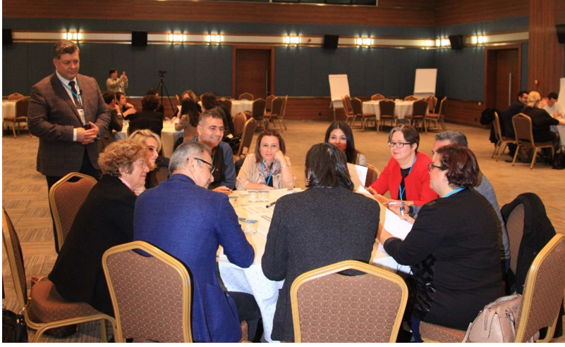
Şekil 2: Katılımcılardan görünüm