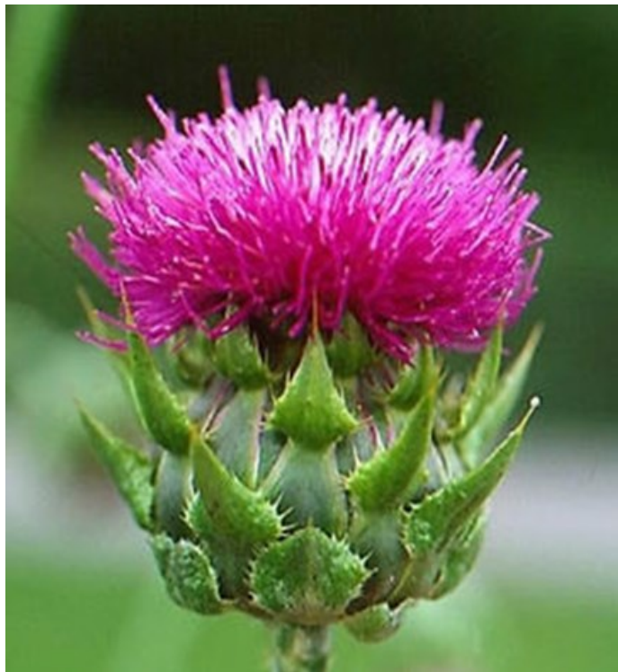
Figura 1. Silybum marianum perteneciente a la familia de Asteraceae.

también es cultivada en Hungría, China y países de Sudamérica como Argentina, Venezuela y Ecuador; se utiliza en el tratamiento de ictericia u otras enfermedades biliares; así como, en terapia de apoyo en la intoxicación por hongos y en el tratamiento de diversas enfermedades hepáticas 1, 15, 16 .