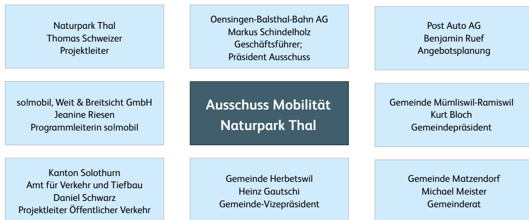
Abbildung 2: Ausschuss Mobilität Naturpark Thal