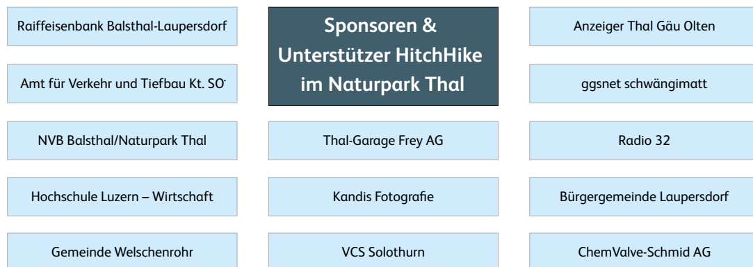
Abbildung 3: Sponsoren und Unterstützer HitchHike im Naturpark Thal