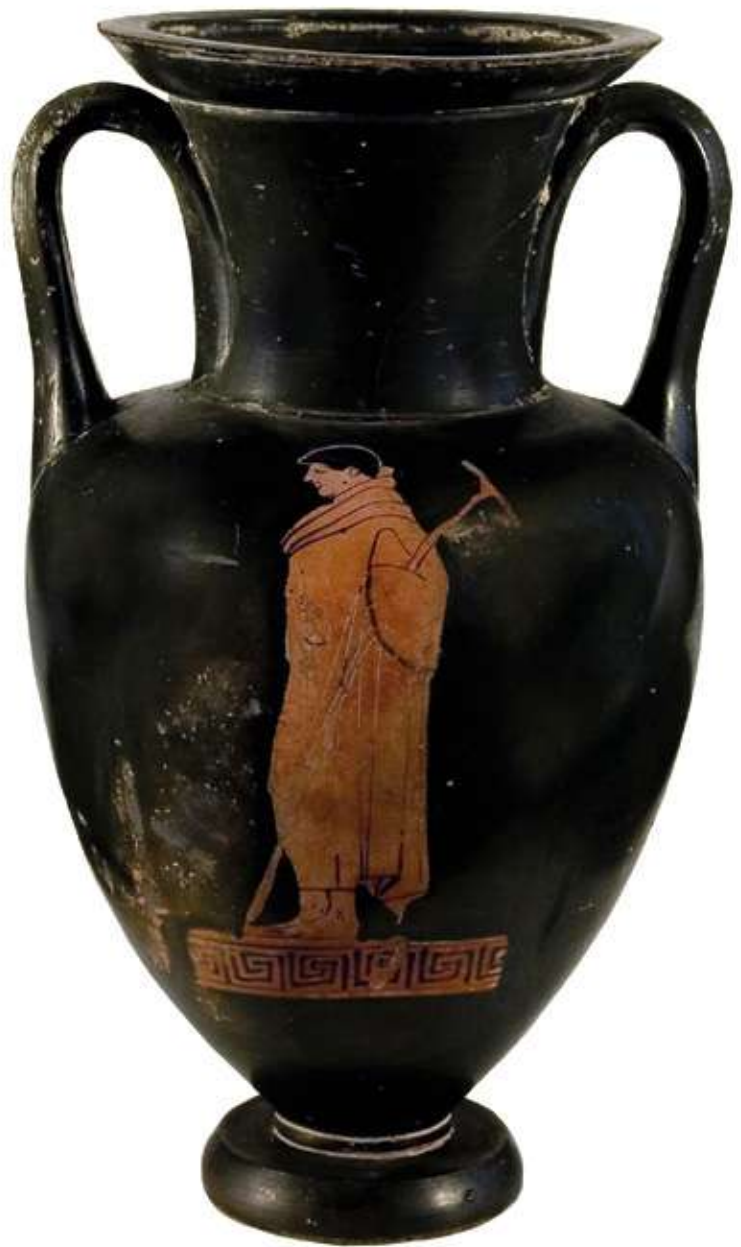
Fig. 1a et 1b : Amphore attique à figures rouges sur laquelle une jeune fille jongle (cat. 119). 460-450 av. J.-C. Milan, Soprintendenza per i Beni Archeologici della Lombardia, inv. Sambon n. 14, St 1323