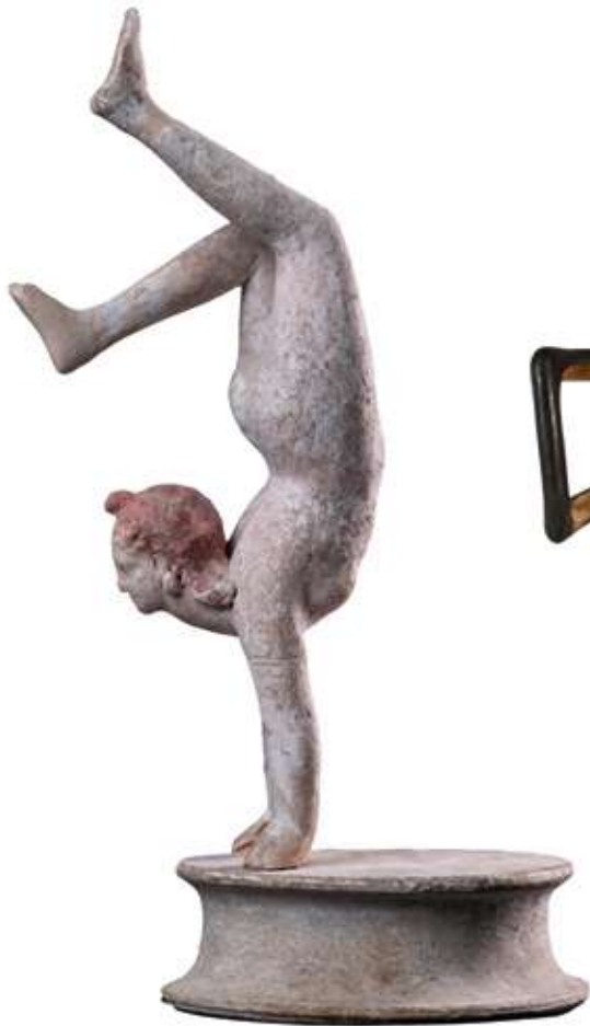
Fig. 2 : Figurine d'acrobate sur les mains (cat. 110) Fin IV e siècle av. J.-C. Tarente, Museo Archeologico Nazionale di Taranto, inv. 4059