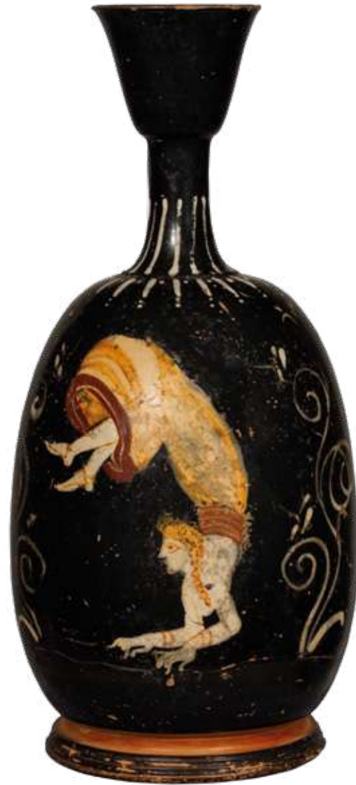
Fig. 1 : Lécythe aryballisque à figures rouges, style de « Gnathia » (cat. II5) 330-320 av. J.-C. Tarente, Museo Archeologico Nazionale di Taranto, inv. 143496

Désignés par une multitude de termes grecs et latins, notamment sous la dénomination