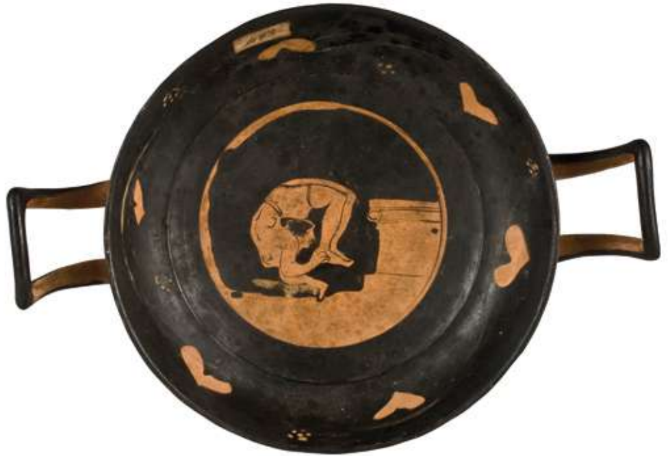
Fig. 4 : Médaille de coupe italiote à figures rouges, acrobate devant un autel (cat. 137). IV e siècle av. J.-C. Ruvo di Puglia, Museo Nazionale Jatta, inv. MJ 35265

l'admiration de la foule, pour de l'argent, en associant une prouesse contre-nature, qui force le corps hors de ses limites naturelles. Le développement de mouvements contrariés éloignés de la mobilité quotidienne qu'incarne parfaitement la posture renversée de l'acrobate, à contre-pied de la normalité, participe à son échelle à la construction d'une altérité visuelle.