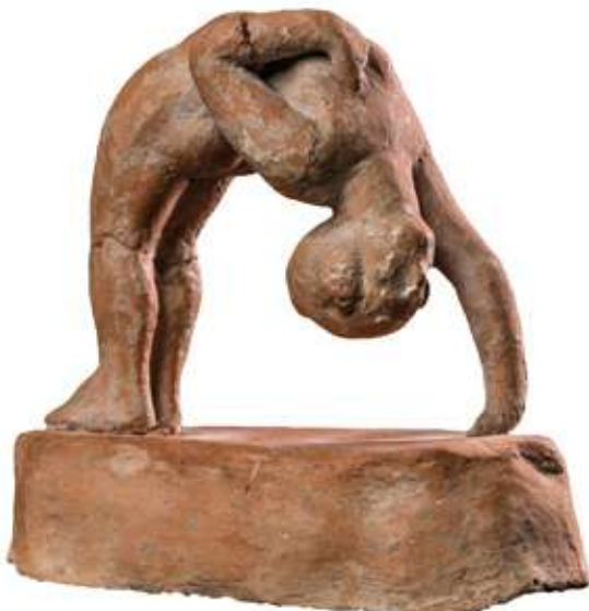
Fig. 3 : Figurine d'acrobate faisant le pont inversé (cat. 131) Fin IV e siècle av. J.-C. Tarente, Museo Archeologico Nazionale di Taranto, inv. 50323