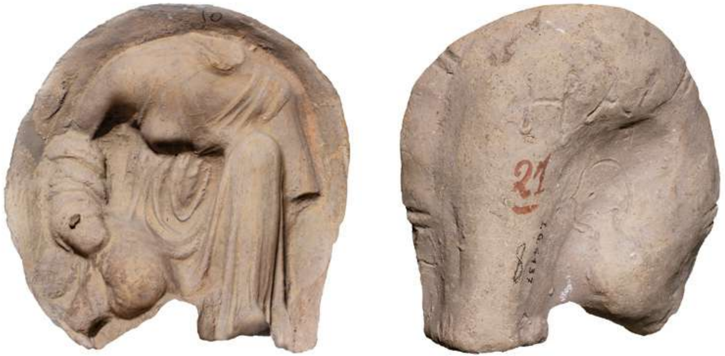
Fig. 2 : Moule en terre cuite de joueuse d'osselets (cat. III) Au dos du moule, inscription : visage et HPA (Hêraklêtos, Hêrakleidês ou Hêraklêis) Tarente, Museo Archeologico Nazionale, inv. 4137

L'étude épigraphique récente de ces moules a permis de suggérer que plusieurs noms, dont HPA , sont féminins, alors que des recherches antérieures avaient proposé d'y lire des noms masculins, ce qui conforte l'hypothèse d'une activité féminine importante au sein des ateliers de coroplastes.