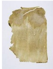
7 . CHARTRES, Bibliothèque municipale, 0029 (0070), f. ?