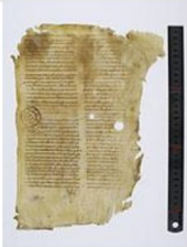
1 . CHARTRES, Bibliothèque municipale, 0029 (0070), f. ?