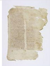
4 . CHARTRES, Bibliothèque municipale, 0029 (0070), f. ?