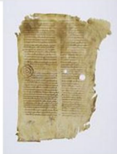
2 . CHARTRES, Bibliothèque municipale, 0029 (0070), f. ?