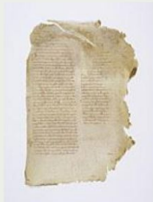
6 . CHARTRES, Bibliothèque municipale, 0029 (0070), f. ?