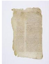
8 . CHARTRES, Bibliothèque municipale, 0029 (0070), f. ?