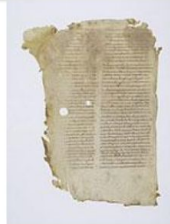
3 . CHARTRES, Bibliothèque municipale, 0029 (0070), f. ?