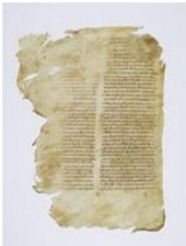
5 . CHARTRES, Bibliothèque municipale, 0029 (0070), f. ?