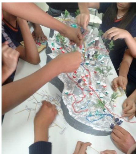
Figura 6: Oficina com a maquete da microbacia do córrego João Gomes Cardoso.

Na oficina, utilizando a maquete, levamos uma representação tridimensional da microbacia do córrego João Gomes Cardoso (Figura 6). A partir dessa representação pudemos gerar, com os participantes, reflexões sobre este território e o ambiente. A maior parte dos estudantes participantes do projeto mora dentro ou próximo dos limites da microbacia, assim, alguns deles apontaram a localização de suas casas e outros pontos de referência e indicaram onde na drenagem da microbacia havia cursos d'água em leito natural, canalizados ou tamponados.