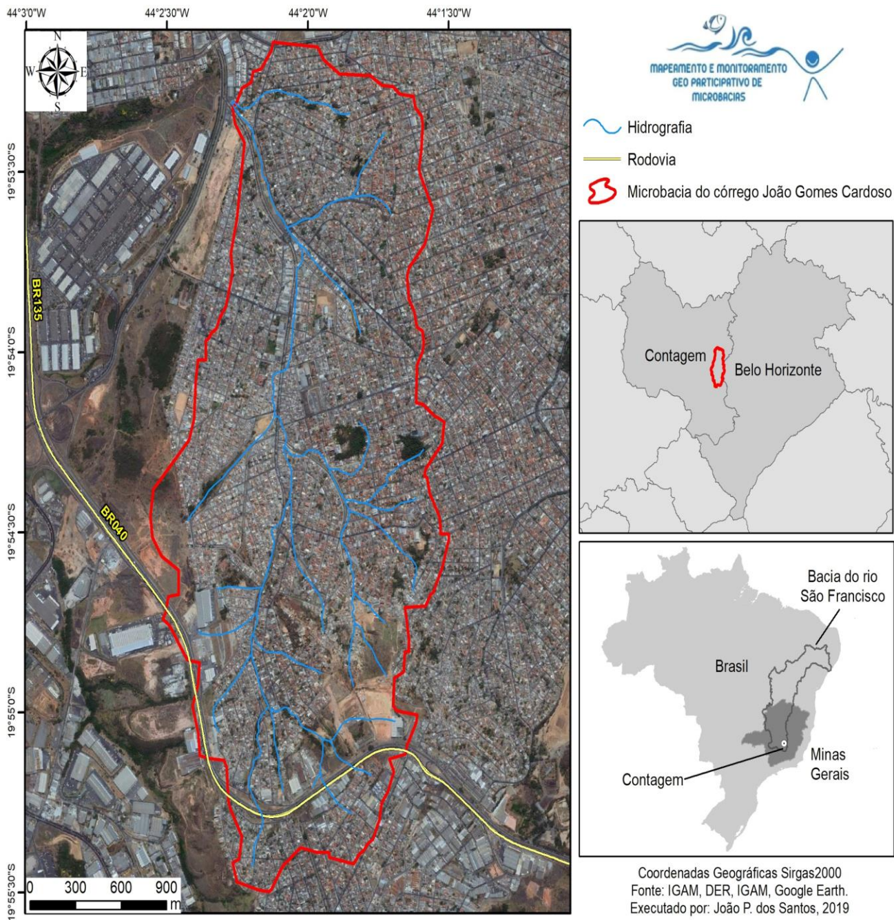
Figura 1: Microbacia do córrego João Gomes Cardoso - Contagem/MG.

afluentes que se encontram canalizados, uns invisíveis sob avenidas e praças, outros em canais abertos onde sua poluição é evidenciada.