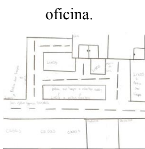
Figura 2: Mapa mental elaborado na oficina.