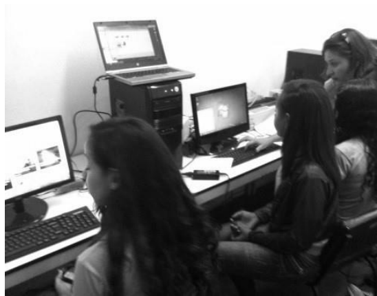
Figura 7: Oficina com a utilização do Google Earth .

Ao utilizar diferentes recursos didáticos, buscamos demonstrar novos discursos e reflexões da produção urbana, principalmente, relacionados aos rios urbanos. Alguns participantes acreditam que somente por meio de projetos como este é que as pessoas poderiam ser alertadas sobre a importância da conservação ambiental para os cursos d'água. Segundo eles, essa educação vinda de instâncias fora da escola proporciona uma nova visão conjunta e participativa, incentivando a comunidade para que deixem de jogar o lixo próximo ao córrego, por exemplo. Outros discentes já relacionam a necessidade da preservação dos cursos d'água em prol de um melhor uso dos recursos hídricos frente aos riscos de outras crises no abastecimento de água, como ocorrido na região Sudeste do Brasil, principalmente em 2014. Parte dos estudantes, ainda, encaram a educação ambiental como a ação de limpeza da rua e dos córregos, feita em parceria entre os alunos e outros projetos ligados à questão ambiental. Isso se deve ao fato de que muitas iniciativas encaram a sensibilização como instrumento para a discussão da problemática ambiental através de ações práticas de manejo direto da poluição/rejeitos diversos.