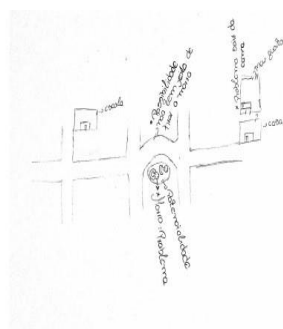
Figura 4: Mapa mental elaborado na oficina