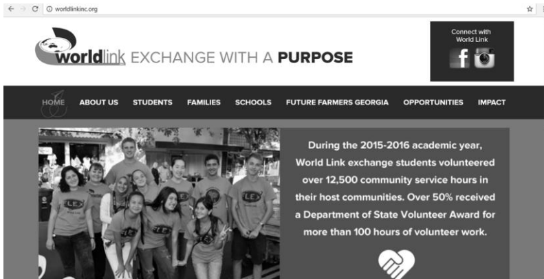
Gambar 6. Web Site World Links

Diakui masih sedikit jumlah studi di negara-negara berkembang yang melaporkan dampak TIK pada siswa dalam pembelajaran. Umumnya, itu adalah negara-negara yang memiliki program yang lebih mapan yang telah beroperasi lebih lama yang mau melaporkan hasil ini. Seringkali studi mengukur pendapat tentang dampak TIK pada siswa karena guru dalam kegiatan pembelajaran. Dalam evaluasi World Links , Kozma et al. (2004) menemukan bahwa siswa yang berpartisipasi dan guru yang berpartisipasi sering melaporkan bahwa siswa belajar keterampilan komunikasi, pengetahuan tentang budaya lain, kemampuan berkolaborasi, dan keterampilan Internet daripada guru dan siswa yang tidak berpartisipasi aktif. Selain data laporan diri ini, sebuah studi yang terhubung (Quellmalz & Zalles, 2000) di satu negara, Uganda, menggunakan penilaian kinerja yang dirancang khusus untuk secara langsung mengukur belajar siswa dalam keterampilan ini, pengujian baik siswa yang berpartisipasi dan