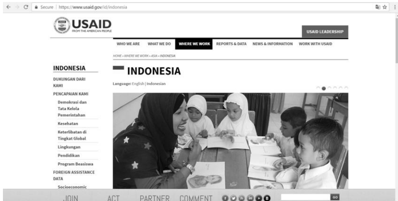
Gambar 4. USAID Indonesia

pemerintah Yordania dan US $ 25 juta dalam bentuk tunai dan dalam bentuk jasa dari sektor swasta untuk mendukung 100 sekolah (Khatib, 2007).