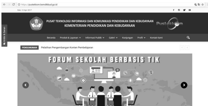
Gambar 2. Web resmi putekkom untuk sekolah berbasis TIK