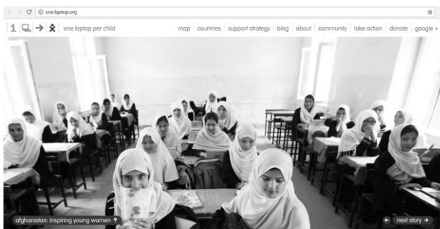
Gambar 1. Web site resmi OLPC

Pendidikan berbasis TIK (teknologi informasi dan komunikasi) di negara-negara berkembang telah menghasilkan jumlah yang signifikan. Sangat menarik dalam beberapa tahun terakhir, sebagian besar disebabkan oleh One Laptop per Child (OLPC) dan apa yang dulu disebut “komputer US $ 100 dolar”. Di antara klaim yang lebih kontroversial yang dibuat adalah bahwa dengan menyediakan laptop murah untuk setiap anak, sebuah negara dapat mengatasi kebutuhan pendidikannya, memerangi kemiskinan, dan berkontribusi terhadap pembangunan ekonomi. Dukungan kekuatan dan dukungan OLPC telah membentuk kehadiran di banyak negara berkembang. Menurut situs Web OLPC, 38 negara berkembang menerapkan OLPC atau bereksperimen dengan hardware XO (nama perangkat keras) mereka dan sistem operasi Gula. Peru dan Uruguay adalah pelaksana terbesar, saat ini menyebarkan 870.000 dan 510.000 komputer XO, masing-masing.