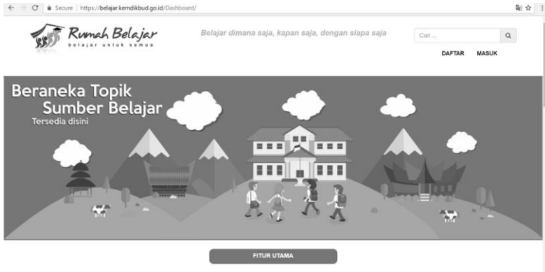
Gambar 3 Konten Pembelajaran yang dapat diakses oleh sekolah di Indonesia

baru alat TIK, kompleksitas pembuatan konten digital, dan kurangnya keseluruhan konten digital dalam bahasa setempat (Unwin, 2007).