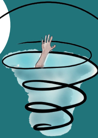
症狀惡化 認知功能障礙