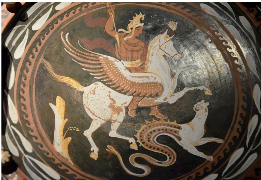
Беллерофонт на Пегасе убивает Химеру, Апулия, 340 – 320 г. до Р.Х.

Поскольку самым сильным стимулом психики человека являются его инстинкты самосохранения и продолжения рода, всё то, что называется сексуальностью, то дракон символизирует не что иное как его собственные генеративные органы, мужской половой член – пенис 7 .