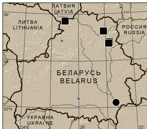
Рис. 7. Места находок видов рода Phyllodesma в Беларуси. Круг – Ph. tremulifolium , квадраты – Ph. japonicum . Fig 7. Localities of Phyllodesma species in Belarus. Circle – Ph. tremulifolium , squares – Ph. japonicum .

Распространение. Вид встречается от севера Пиренейского полуострова через Южную и Среднюю Европу до юга европейской части России и Зауралья – подвид Ph. tremulifolium tremulifolium (Hübner, [1810]); на юге Западной Сибири, в Северном и Северо-Восточном Казахстане – подвид Ph. tremulifolium gemela Zolotuhin, 1991; на Южных Балканах и в Турции – подвид Ph. tremulifolium danieli Lajonquière, 1963. В Латвии и Литве не отмечен. В Польше встречается преимущественно на юго-западе и востоке, очень редок [Золотухин, 2015; Buszko, Masłowski, 2012].