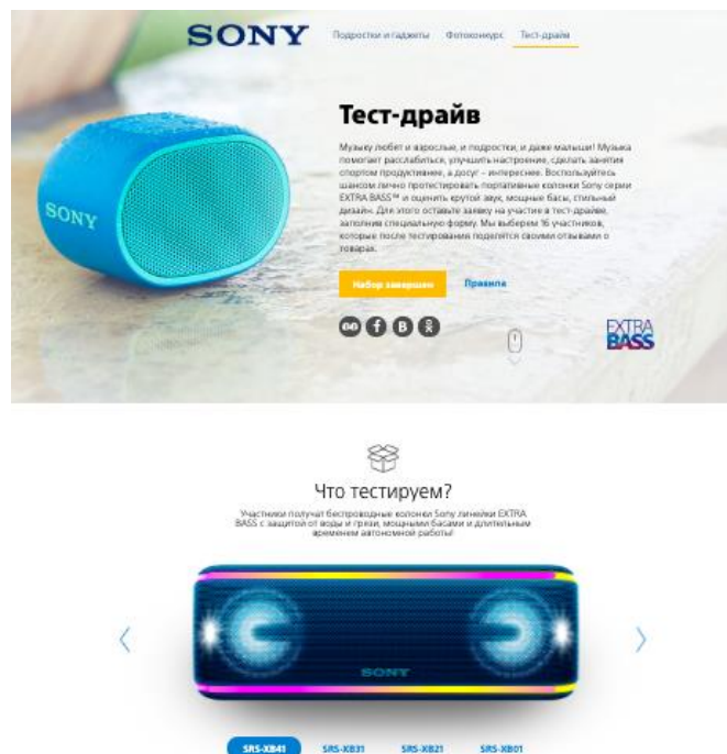
Рисунок 2. Раздел тест-драйва проекта Sony

Механика тест-драйва (Рисунок 2): пользователи заполняли заявки на участие в соответствующем разделе на сайте babyblog.ru . Из заявок отбирались анкеты претендеток на участие по параметрам: возраст, количество детей, возраст детей и география. Финальный список участниц согласовывался с клиентом (брендом Sony). Участницам, прошедшим отбор, отправили сэмплы (продукция) для тестирования. После тестирования продукта бренда участницы опубликовали отзывы в единой ленте раздела. Отзывы участниц обязательно содержали фото с продуктом.