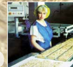
Коломенский булочно- кондитерский комбинат