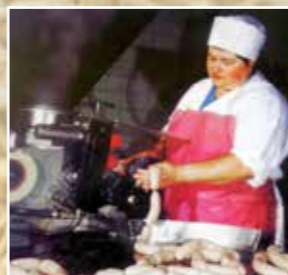
Коломенский колбасный завод