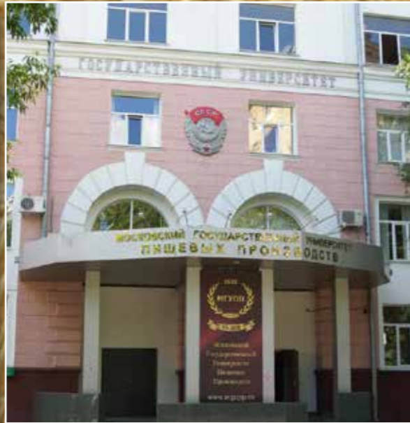
Московский государственный университет пищевых производств