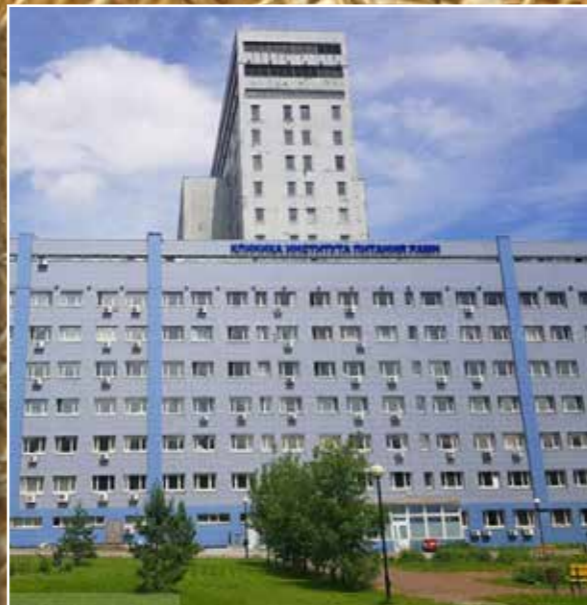
Федеральный исследовательский центр питания, биотехнологии и безопасности пищи