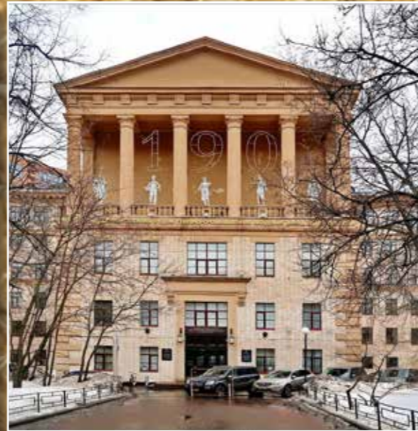
Московская государственная художественно-промышленная академия им. С. Г. Строганова