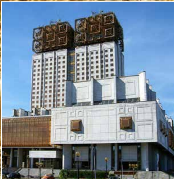
Институт этнологии и антропологии им. Н. Н. Миклухо-Маклая РАН