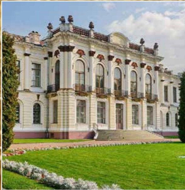
Московская сельскохозяйственная академия им. К. А. Тимирязева