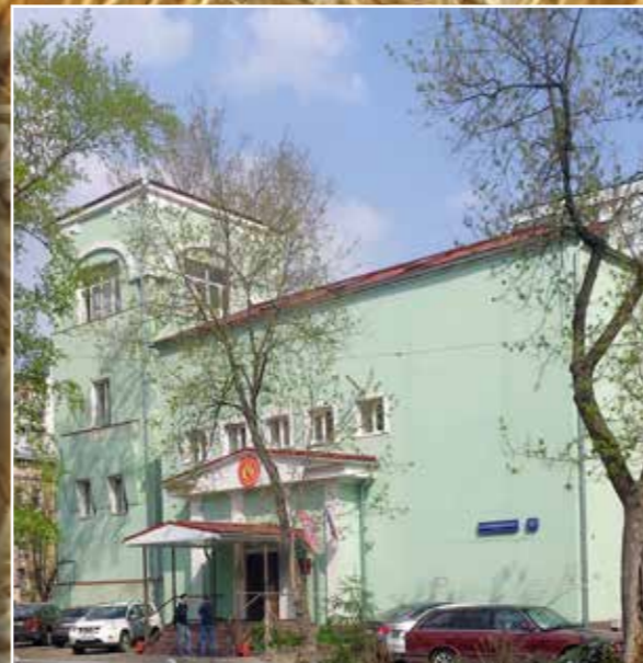
Российская академия предпринимательства