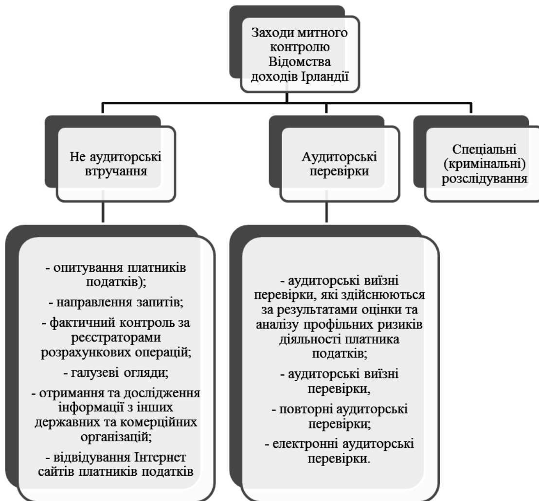
Рис. 2. Форми контролю, що здійснюються Відомством доходів Ірландії