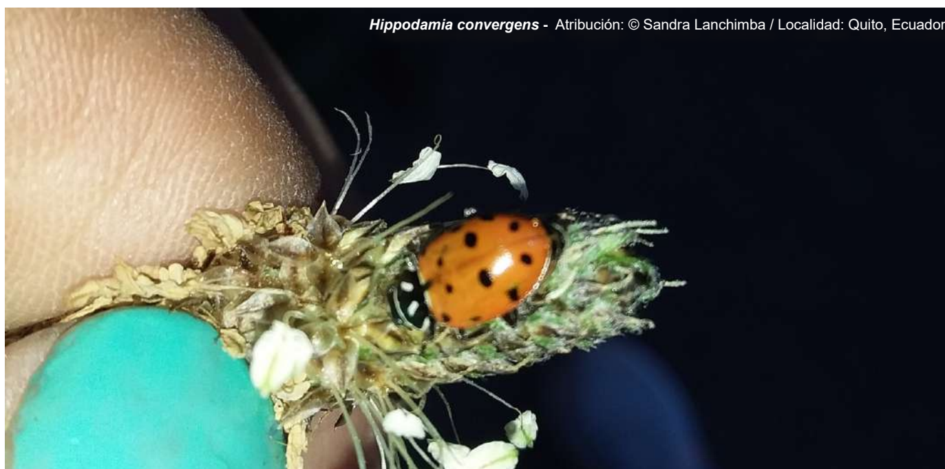
Hippodamia convergens - Atribución: © Sandra Lanchimba / Localidad: Quito, Ecuador

El Convenio de Diversidad Biológica (CDB) en su Art. 8 literal h y en decisiones posteriores de sus conferencias ha reconocido a las especies exóticas invasoras como una de las principales amenazas a la diversidad biológica, especialmente en los ecosistemas geográficos y evolutivamente aislados, tales como los pequeños estados insulares en desarrollo, y que los riesgos pueden aumentar debido al incremento del comercio mundial, el transporte, el turismo y el cambio climático, motivo por el que varias estrategias del CDB instan a los países parte, a la generación de mecanismos específicos para la gestión efectiva de estas especies a nivel global (CDB, 2017).