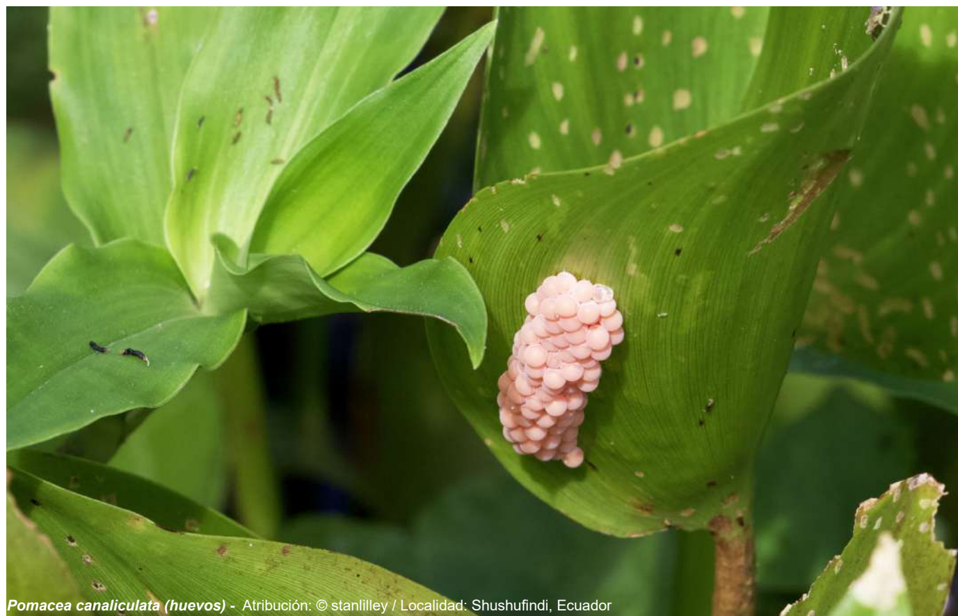
Pomacea canaliculata (huevos) - Atribución: © stanlilley / Localidad: Shushufindi, Ecuador

Este plan de acción buscará la obtención de recursos financieros para su implementación a través de la generación de mecanismos de financiamiento fiscal o de cooperación, con la respectiva construcción de un ciclo de sostenibilidad financiera.