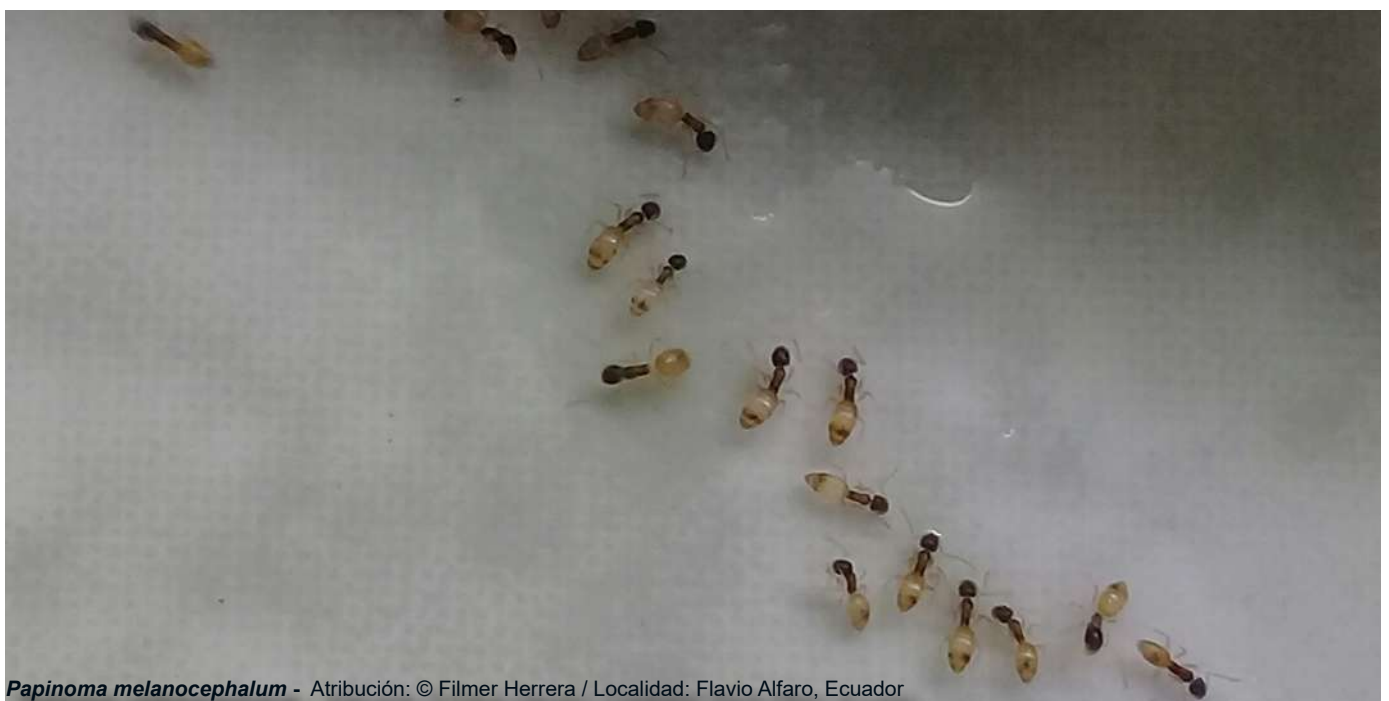
Papinoma melanocephalum - Atribución: © Filmer Herrera / Localidad: Flavio Alfaro, Ecuador

Elaborar e implementar sistemas de prevención, alerta temprana, respuesta inmediata; y, mecanismos de mitigación, contención, control y/o erradicación frente a especies exóticas, procurando la restauración de los ecosistemas.