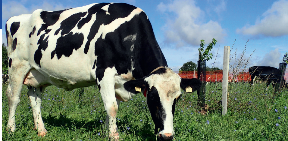
Vacas leiteiras a pastar num cercado plantado recentemente com árvores forrageiras.