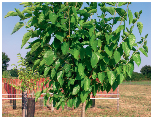
Amoreira branca e pastagem em Agosto de 2016 Ref: Sandra Novak

O pastoreio é um aspeto fundamental da gestão para a poupança de água e energia. Contudo, a quantidade e qualidade da forragem dependem muito das condições climáticas. Nas regiões atlânticas francesas, as pastagens fornecem alimento na primavera e, em menor quantidade, no outono. No entanto, a produção de pastagem reduz-se muito no verão. As alterações climáticas irão provavelmente aumentar as condições de secura no fim da primavera e no verão, aumentando a variabilidade da produção anual de pastagem. As árvores e arbustos podem assim ser uma fonte de forragem complementar nas explorações leiteiras.