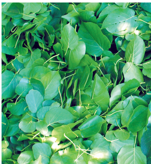
Folhas de amieiro-napolitano recolhidas para análise. Ref: Jean-Claude Emile