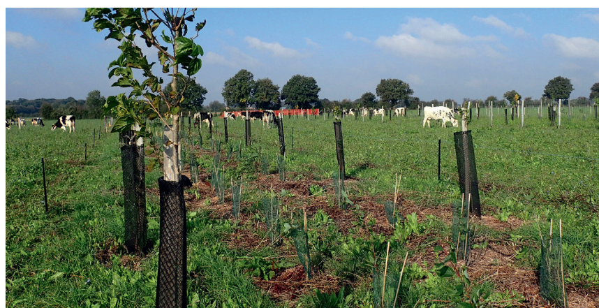
Pastagem herbácea e arbórea numa parcela de demonstração cercada para ruminantes em Lusignan (França)

Adicionalmente, foi avaliado o valor nutritivo das folhas de várias plantas lenhosas para determinar quais as espécies que poderiam ser incluídas na dieta das vacas lactantes.