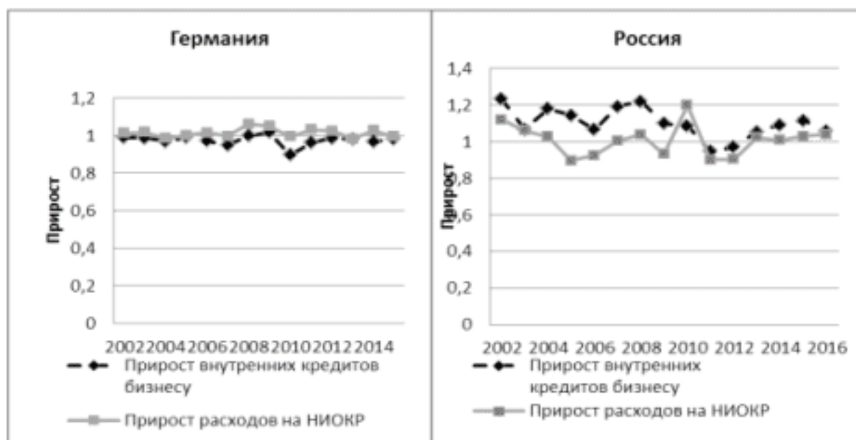
Рисунок 2 - Темп роста внутренних кредитов бизнесу и темп роста расходов на НИОКР, страновое сравнение

Если рассматривать возможности привлечения капитала для финансирования инвестиций, возможно, предположить различные источники для развитых и развивающихся стран. К примеру, долгового капитал может привлекаться для стимулирования расходов на НИОКР, а не на обслуживание текущего долга или операционной деятельности. Сравнительный анализ Германии, как примера страны с развитым рынком, и России, с развивающимся, выявил трендовую связь инвестиций в НИОКР и отечественных кредитов, выданных бизнесу. В абсолютном значении расходы на НИОКР по отношению к ВВП в Германии превосходили в 2 раза затраты к ВВП в России. Для Германии прирост расходов на НИОКР превышает прирост получаемых кредитов в отличие от России.