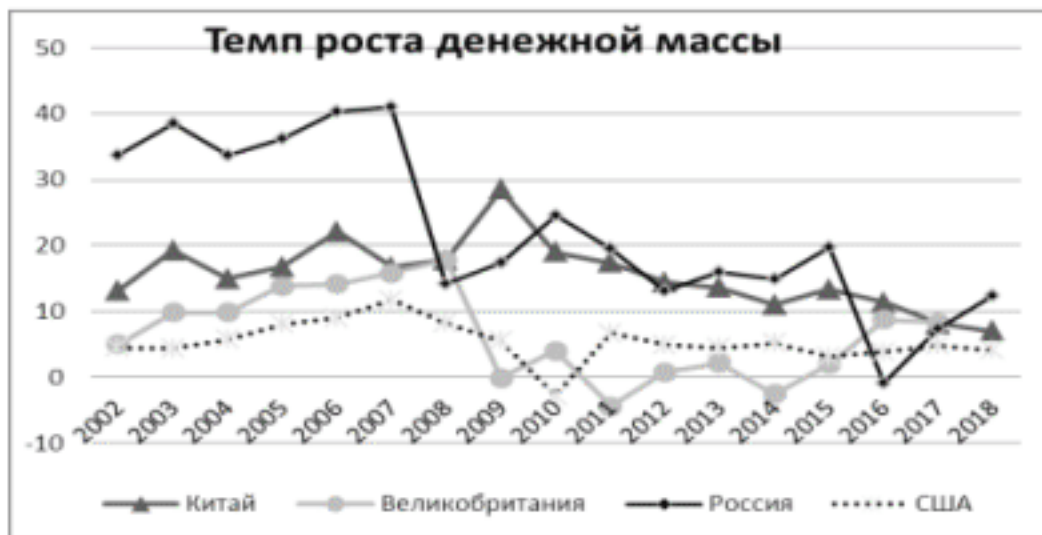
Рисунок 3 - Темп роста денежной массы по отношению к прошлому году

влияния. Такие связи будут доказаны на основе коэффициентов корреляции, моделей регрессионного анализа. Выявлена наиболее сильная положительная состоятельная корреляция монетизации и роста реального ВВП для средне-доходных стран по сравнению с высокоразвитыми, где монетизация экономики и так достаточно высока. Связь с экономическим неравенством и потреблением не является одинаковой для различных стран.