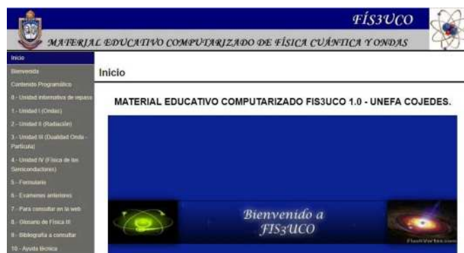
Figura II. Material educativo computarizado FIS3UCO usado como medio para la estrategia