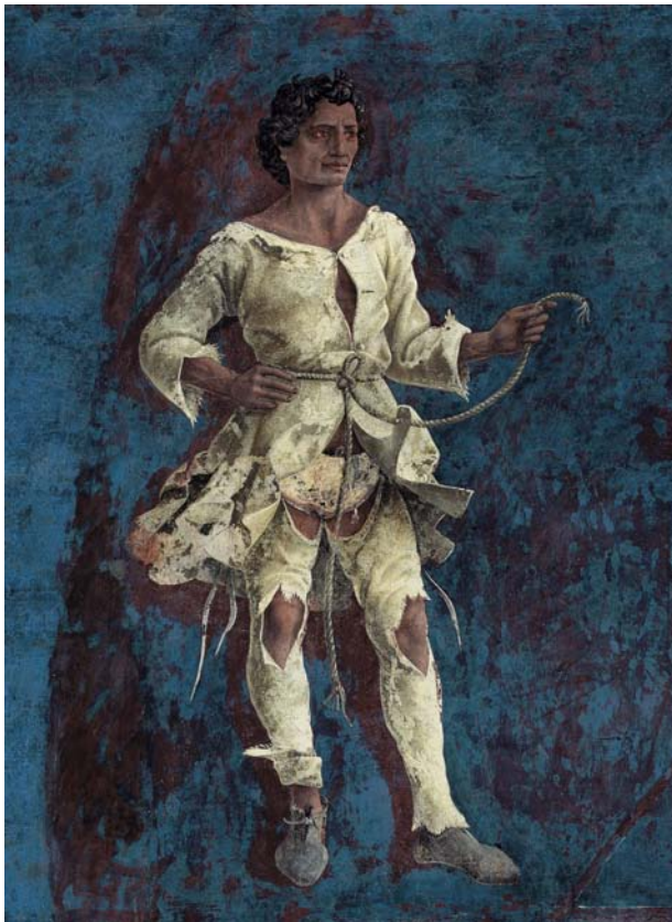
Il primo decano dell'Ariete (Ferrara, Palazzo Schifanoia, Salone dei Mesi).

seo): «Gli indiani affermano che in questo decano si leva un uomo di carnagione scura, dagli occhi rossi, di alta statura, forte coraggio ed elevati sentimenti. Egli porta un'ampia veste bianca, cinta in mezzo da una corda; è adirato, sta dritto, custodisce e osserva» 6 . Il decano di Schifanoia, diversamente dal testo di Albumasar, indossa giacca e pantaloni bianchi stracciati e tiene, con la mano sinistra, un capo della corda annodata in vita.