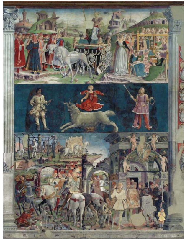
Francesco del Cossa: Mese di Marzo, segno zodiacale dell'Ariete (Ferrara, Palazzo Schifanoia, Salone dei Mesi).

dalle tre enigmatiche immagini dei "decani"; nella fascia superiore, trionfano i grandi dèi dell'Olimpo greco, che hanno qui sostituito la tradizionale reggenza delle divinità planetarie.