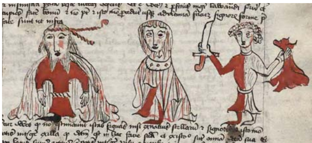
Picatrix: i tre decani dell'Ariete (Cracovia, Biblioteca Jagellonica, MS 793, p. 359).

Tuttavia, è bene aggiungere, non è stato finora possibile rintracciare un'unica lista di decani, che trovi plausibile corrispondenza alla serie delle ventuno immagini superstiti di Schifanoia. In effetti, bisogna fare appello ad una numerosa serie di versioni e compendi latini di Albumasar o al trattato di magia talismanica Picatrix , per trovare descrizioni parallele a quelle dei decani di Ferrara.