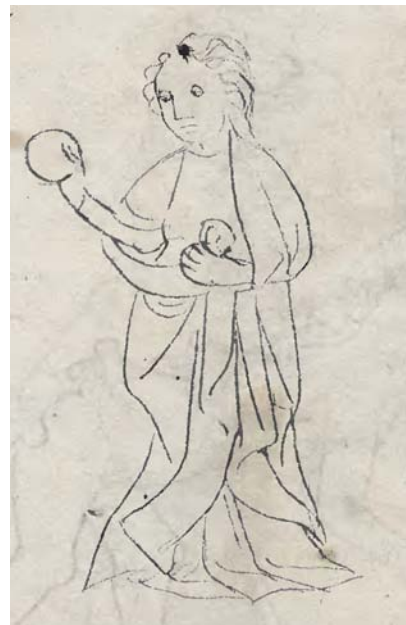
Picatrix: il primo decano della Vergine (Cracovia, Biblioteca Jagellonica, MS 793, p. 388).