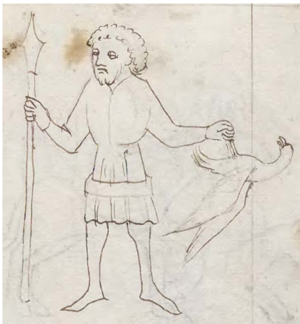
Picatrix: il primo decano della Bilancia (Cracovia, Biblioteca Jagellonica, MS 793, p. 389).

I tre decani della Bilancia (Mese di Settembre, Ferrara, Palazzo Schifanoia, Salone dei Mesi). Il primo decano della Bilancia è un uomo che suona uno strumento a fiato, sorretto con la destra, e tiene con la sinistra un uccello capovolto (attributo mancante in Albumasar, ma attestato da Picatrix) legato ad un bastone, come se lo stesse pesando (allusione al segno zodiacale della Bilancia).