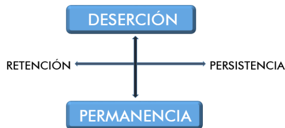
Figura 1. Conceptos relacionados con el abandono escolar

La relación de las dimensiones tomadas para el análisis de las variables que inciden en la permanencia estudiantil, cimentan los resultados de la presente investigación. (Figura 1). Pevio al inicio de la identificación de las dimensiones en mención, se describe inicialmente la caracterización de la muestra, dando claridad y organización a los resultados.