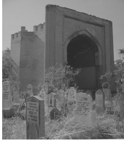
Res.20: Gömeç hatun