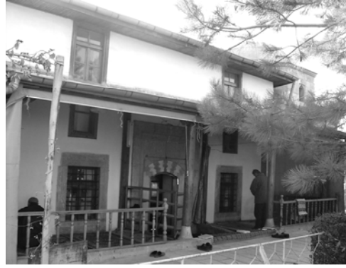
Res.10: Kapı ve pencereler