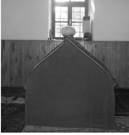
Res.19: Tahta sanduka