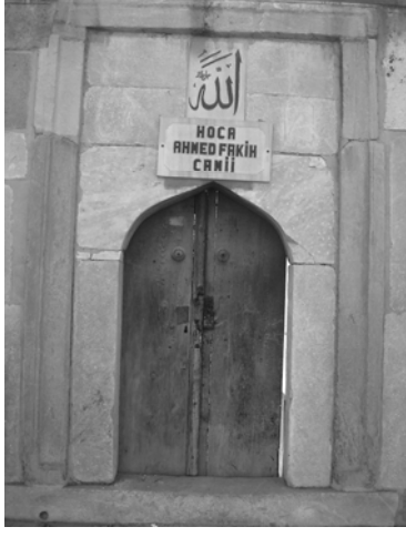
Res.1: dış kapı