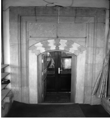
Res.9: Caminin giriş kapısı