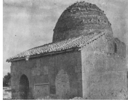
Res.28: Karatay Mescidi son cemaat yeri