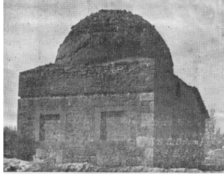
Res.26: Karatay Mescidi dış yüzeyi