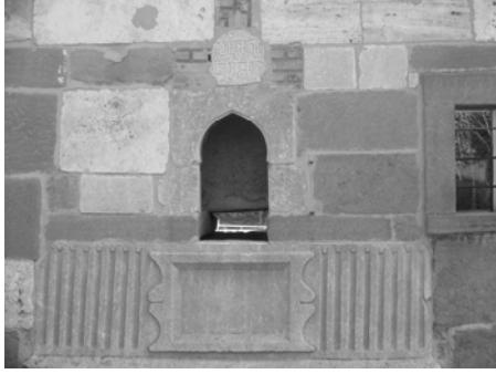
Res.3: Sebیل nişı