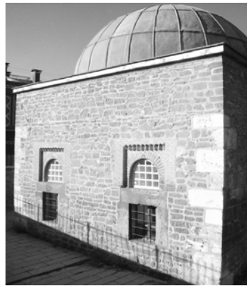
Res.24: Karatay Mescidi pencereleri