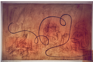
Paul Klee Ohne Titel (Durchlichtaufnahme von Träger für ein Schild, 1934, 72, seiten- verkehrt)