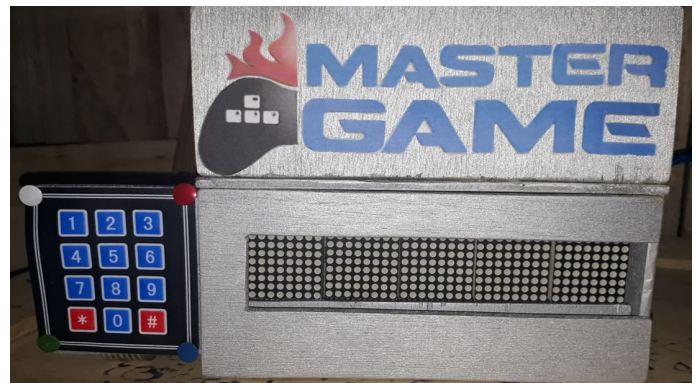
Figura 4. Conexionado de la circuitería del juego.

En la figura 4 se muestra el diseño físico del Master Game, el cual fue realizado de forma artesanal y a bajo costo.