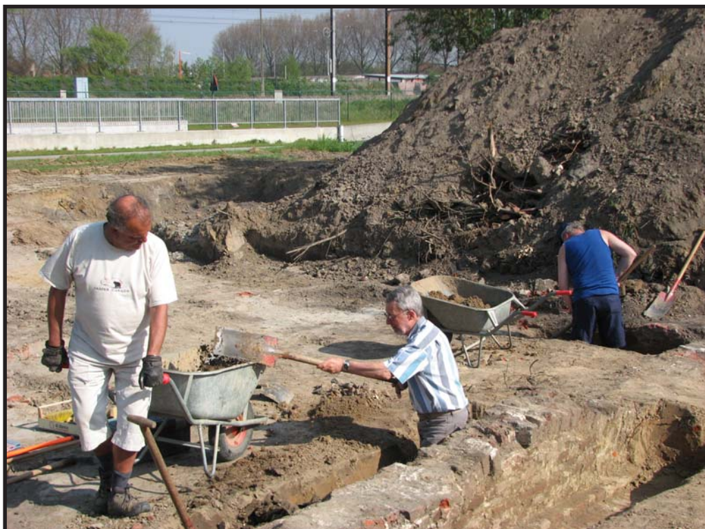
2007 Roeselare Prins Albertstraat opgraving noordelijk deel