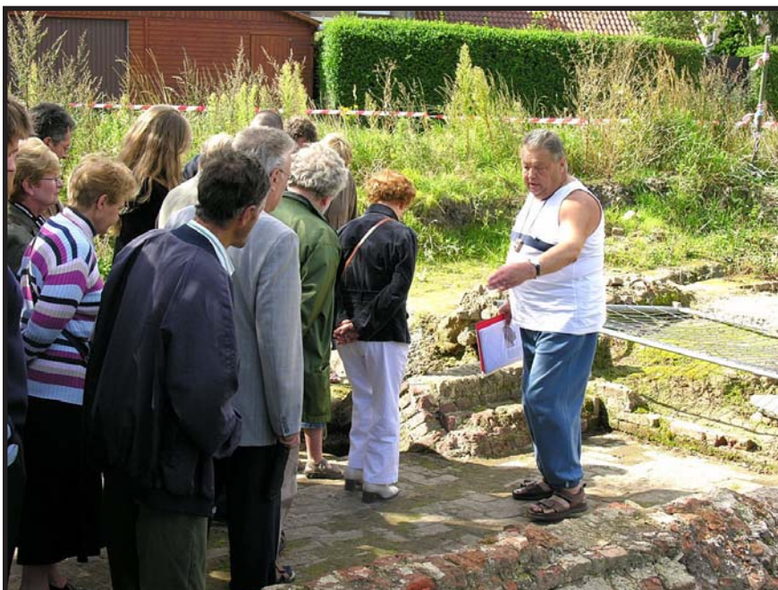
Rondleiding op O.M.D 2007

De Stad Roeselare voor de subsidie voor deze publicatie, eenmalig in een gedeeltelijke kleurenditie.