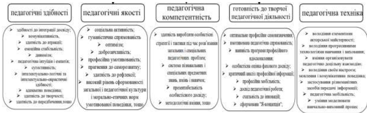
Рис. 3. Структура педагогічної майстерності педагога

Як наголошує Т. Шамова, не забезпечується необхідне стимулювання формування особистості з філософським світосприйняттям, високим рівнем освіченості й організаційної культури педагога-керівника, здатного на перехід від авторитарного стилю до «педагогіки вільної особистості» [11].