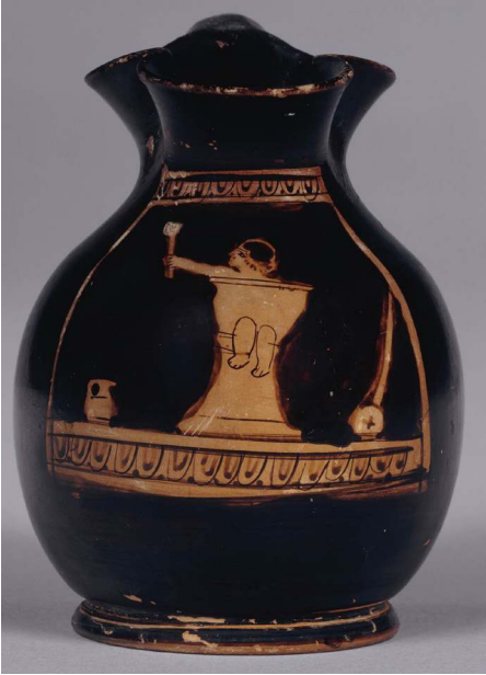
Fig. 8 – Chous attique à figures rouges. Londres, British Museum 1910.6-15.4.