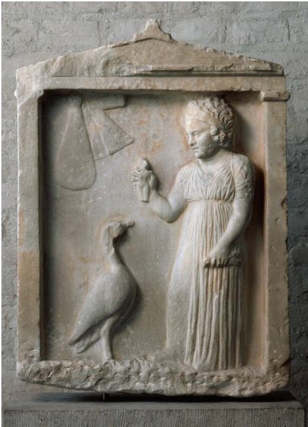
Fig. 9 – Stèle attique en marbre. Munich, Antikensammlungen GL 199.