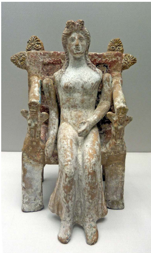
Fig. 10 – Poupée assise aux bras articulés en terre cuite (H. 21,5 cm), de Thèbes. Munich, Antikensammlungen NI 6660.