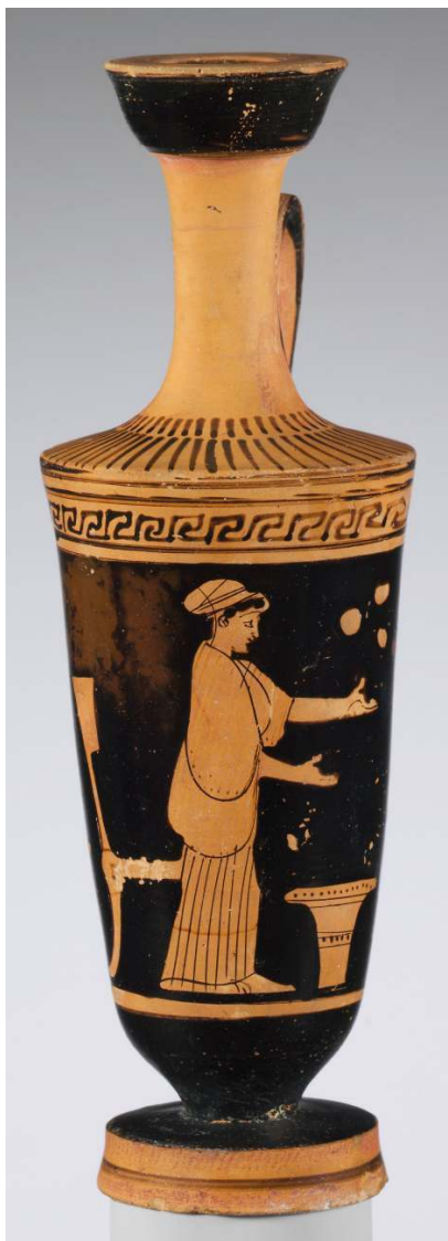
Fig. 3 – Lécythe attique à figures rouges. New York, Metropolitan Museum of Art 41.162.147. Rogers Fund, 1941.