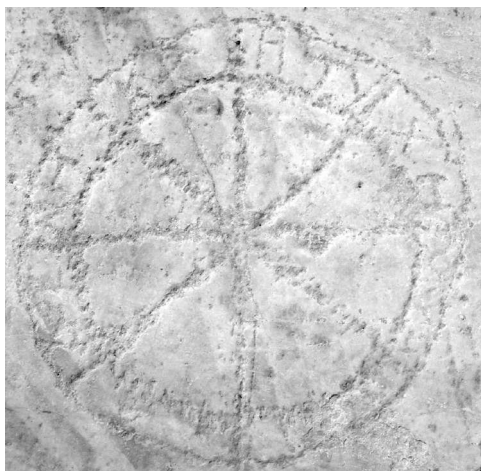
Fig. 6 – Dessin de roue avec une inscription grecque sur la rue Arkadiane, Ephèse.