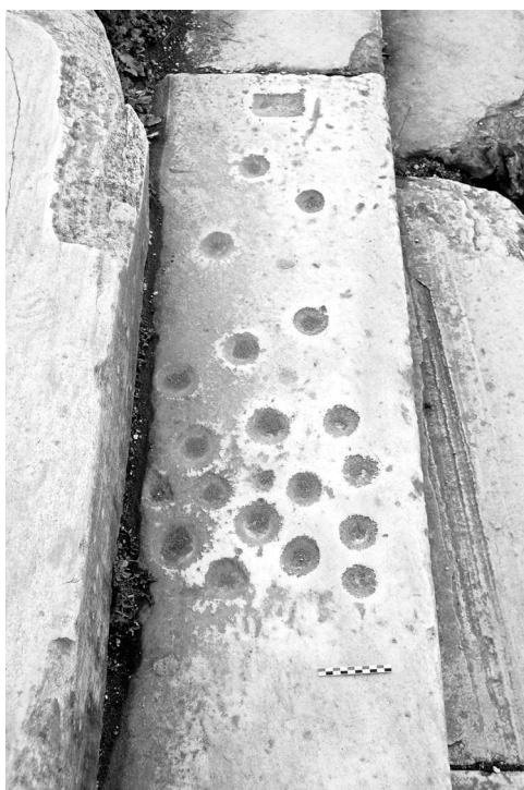
Fig. 7 – Piste de billes, Rome, temple de Vénus et de Rome.