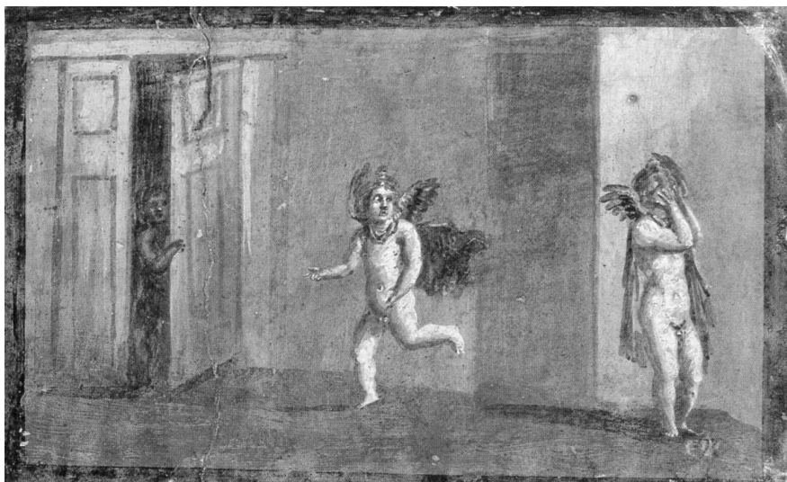
Fig. 1 – Peinture murale du cryptoportique de la Maison des cerfs, Herculaneum.

Tableautin 23 x 36 cm. Naples, Musée national, inv. 9178.