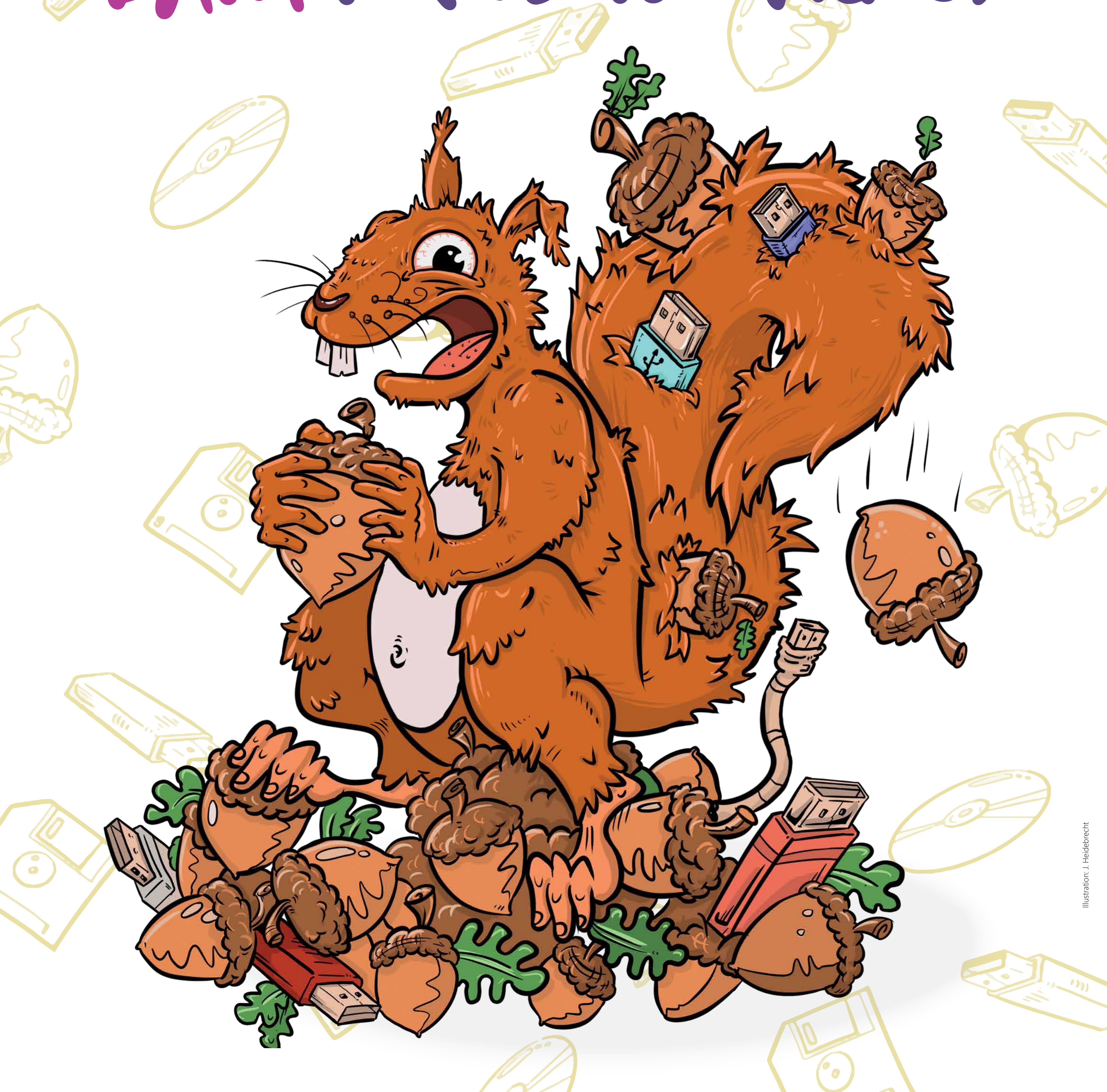
Illustration: J. Heidebrecht

Deine Dateiablage ist ein Schlachtfeld? Dein letztes Back-up ist uralt – und jetzt ist auch noch die Festplatte gecrasht? Du schonst deine Nerven, indem du von Anfang an Struktur ins Datenchaos bringst.