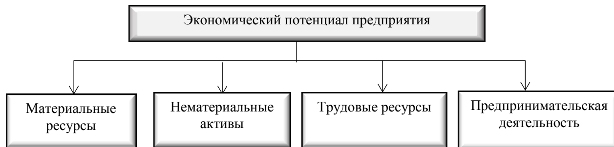
Рисунок 1 Экономический потенциал предприятия (разработано автором на основе исследований)

материальными ресурсами, нематериальными активами и трудовыми ресурсами, поэтому четвертый фактор может определять экономический потенциал предприятия с использованием предпринимательских способностей.