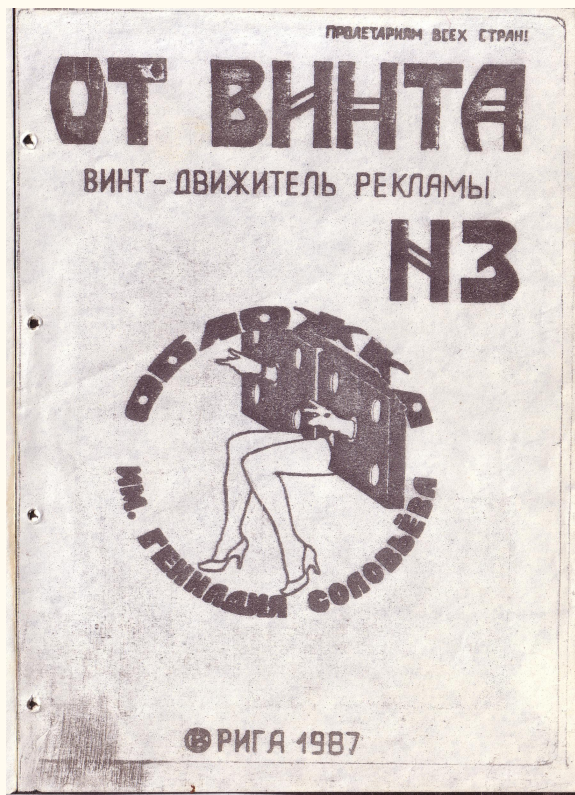
Nr. 3, A5, b/w, 122 pages