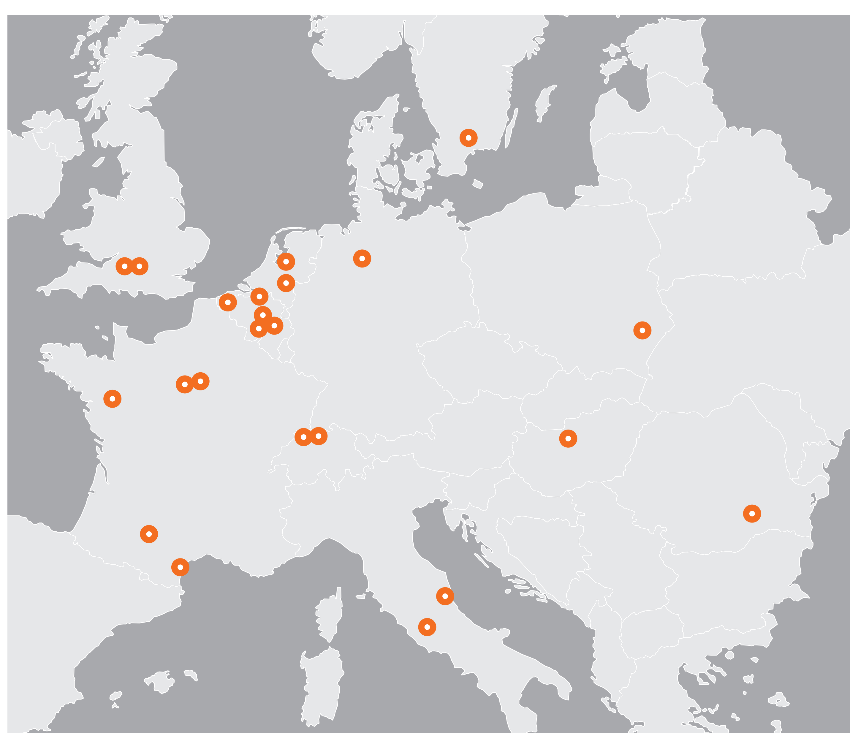
Harta studiilor de caz DiverIMPACTS