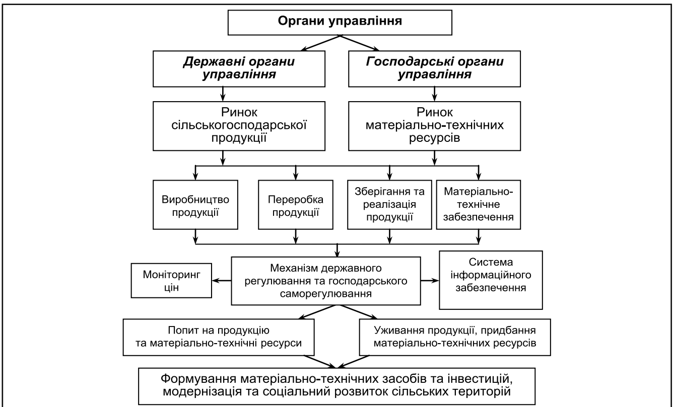
Рисунок 3. Складові елементи системи державного регулювання і саморегулювання ринку сільськогосподарської продукції