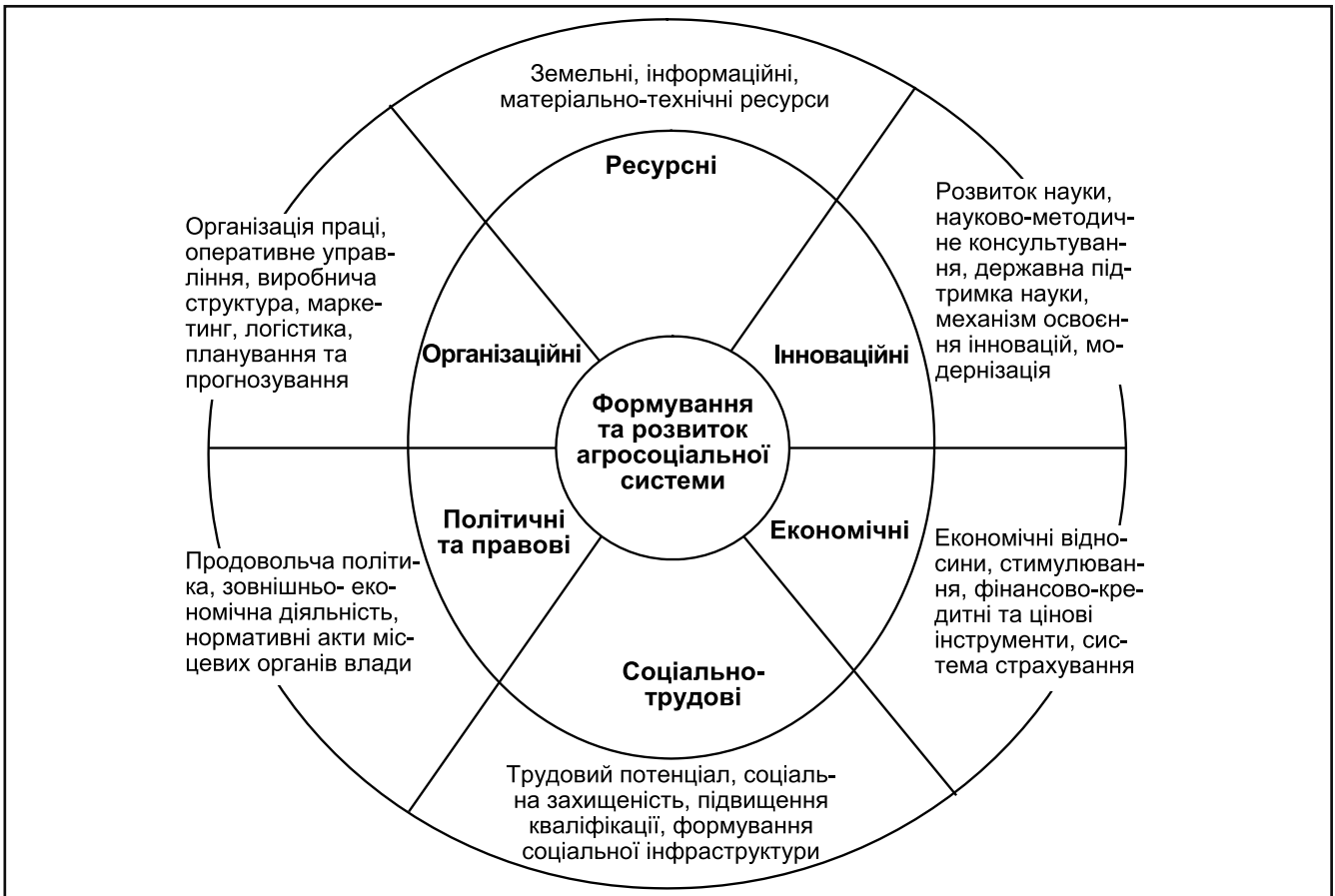
Рисунок 2. Класифікація чинників розвитку агросоціальної системи