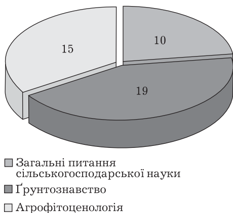
Рис. 3. Контент-аналіз наукових праць А.М. Гродзинського з напрямку «сільськогосподарські дослідження», кількість одиниць

«Спрямоване виховання рослин» та «Ріст рослин» [23–25];