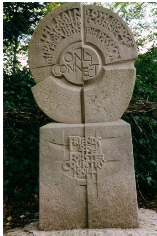
Abb. 1: Skulptur zu Ehren von E.M. Forster