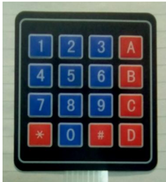
Slika 1, Tastatura sa 16 polja koja je na raspolaganju studentima/kinjama u IZAZOVU.

U administratorskom pristupu je moguće dodavati i brisati korisnike tj. službena lica, a u korisničkom pristupu je moguće putem unosa šifre (koju je odredio administrator otvoriti vrata).