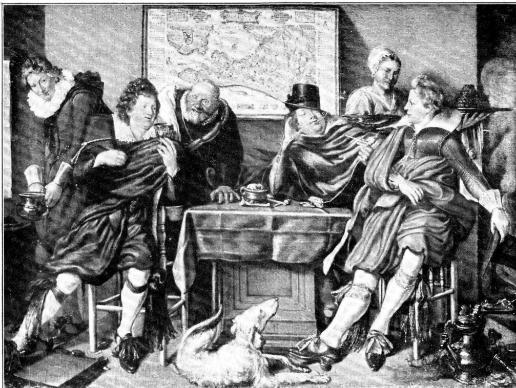
Afb. 8. W. BUYTEWECH, Schilderij, verkocht bij FRED. MULLER & Co. 19 Juni 1913