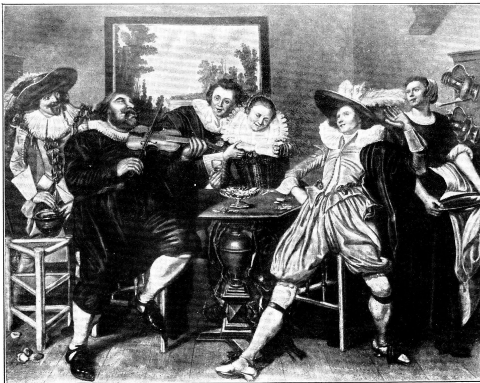
Afb. 9. W. BUYTEWECH, Schilderij in de verzameling ELKINS te New-York.