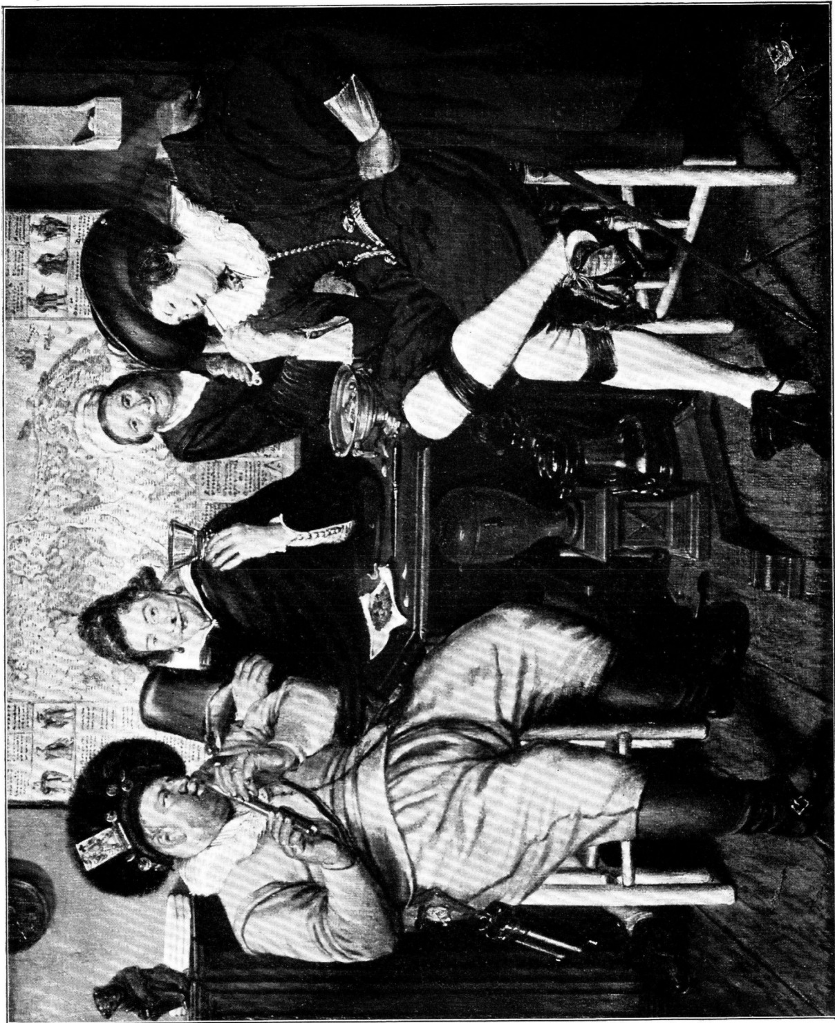
Afb. 6. W. BUYTEWECH, Schilderij in de verzameling KRONIG te 's-Gravenhage.