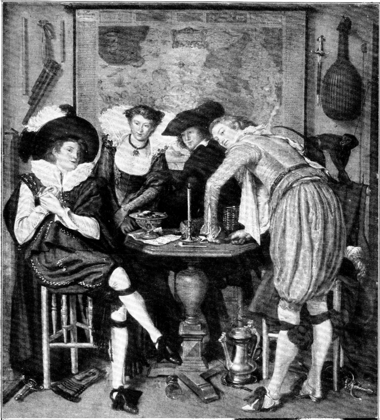
Afb. 4. W. BUYTEWECH, Schilderij in het Museum te Boedapest.