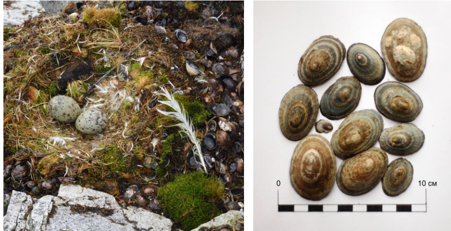
Рис. 1. Гніздо Larus dominicanus (зліва) на о. Галіндез та одна pelletка дорослої домініканської чайки звідти ж (справа)

Як у гніздах Larus dominicanus , так і безпосередньо біля них (рис. 1) завжди багато мушель антарктичного лімпета ( Nacella concinna ), оскільки цей вид моллюсків складає основу раціону домініканської чайки. М. Фаверо та ін. [9], провівши аналіз 237 погадок зібраних на острові Кінг-Джордж (Південні Шетландські острови) встановили, що упродовж гніздового періоду, антарктичний лімпет складає до 40% денного раціону Larus dominicanus . Ці ж автори встановили, що середня довжина мушель у pelletках становила 26,66 \pm 6,43 мм і коливалась від 5 до 46 мм. У наших дослідженнях, середня довжина мушель у pelletках становила 36,36 \pm 5,37 мм, а маса одної pelletки могла сягати 14 г (рис. 1). Мушлі більшого розміру – до 55-60 мм, птахи не проковтували, тому їх більше на березі та кормових столиках і менше у гніздах та безпосередньо біля них.