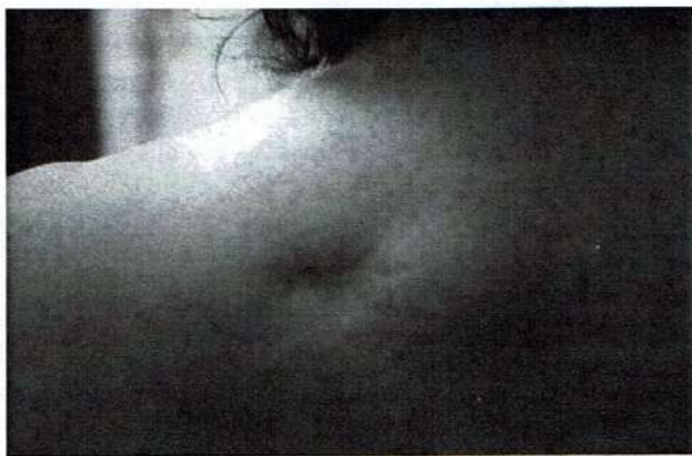
Fig. 2. Caso 5 (P.R.). Cicatrice dorsale alta sinistra (prima del trattamento).

non ricorda la causa) (Fig. 1), che si presenta dolentissima alla palpazione, danno un progressivo miglioramento della sintomatologia, fino alla scomparsa (12.99). Alla parziale ricomparsa dei sintomi dopo 8 mesi, altre 2 infiltrazioni (28 e 31.8.2000) della sola cicatrice glutea (quella addominale non era più dolente) provocavano la quasi totale scomparsa del dolore, che è durata fino all'ultimo follow-up (28.7.2005), dopo 4 anni e 7 mesi (22).