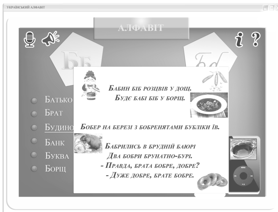
Малюнок 3. Екран роботи зі скоромовками

Робота зі скоромовкою починається при активації звукового плеєра. З початком звучання скоромовки на екрані з'являється текст. Прослухавши скоромовку, студент відтворює її, дивлячись на текст. На другому етапі відбувається повторення скоромовки без тексту на екрані.