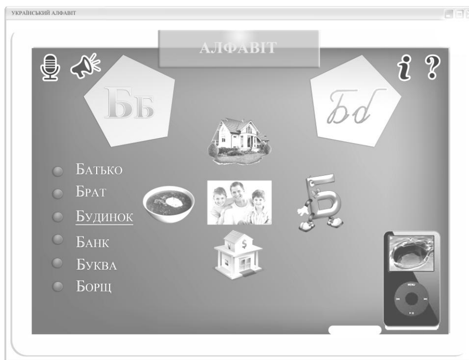
Малюнок 2. Екран робочої зони букви «Б»

З головної сторінки тренажера студент може увійти в зону активного імітативного тренінгу кожної букви. Для цього достатньо активувати потрібну букву наведенням на неї курсора і зробити подвійне клікання (мал. 2). На малюнку 2 зображено робочу зону імітативного тренажера, де представлена аудіовізуальна реалізація літери «Б» у межах частотного лексичного мінімуму вступного фонетичного курсу. При натисканні на плеєр студент чує звукову модель слова і спостерігає одночасне переміщення образу цього слова на передній план. (На екрані активовано слово «Будинок»).