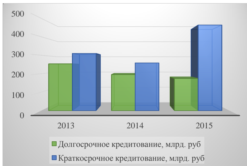
Рисунок 2. Соотношение краткосрочного и инвестиционного кредитования АПК Россельхозбанком в 2013–2015 г. г. (Составлено автором на основании: Годовые отчеты банка Россельхозбанка за 2013–2015 годы / Россельхозбанк: официальный сайт: www.rshb.ru/ ).

Соотношение краткосрочного и инвестиционного кредитования АПК Россельхозбанком отражено на Рисунке 2.