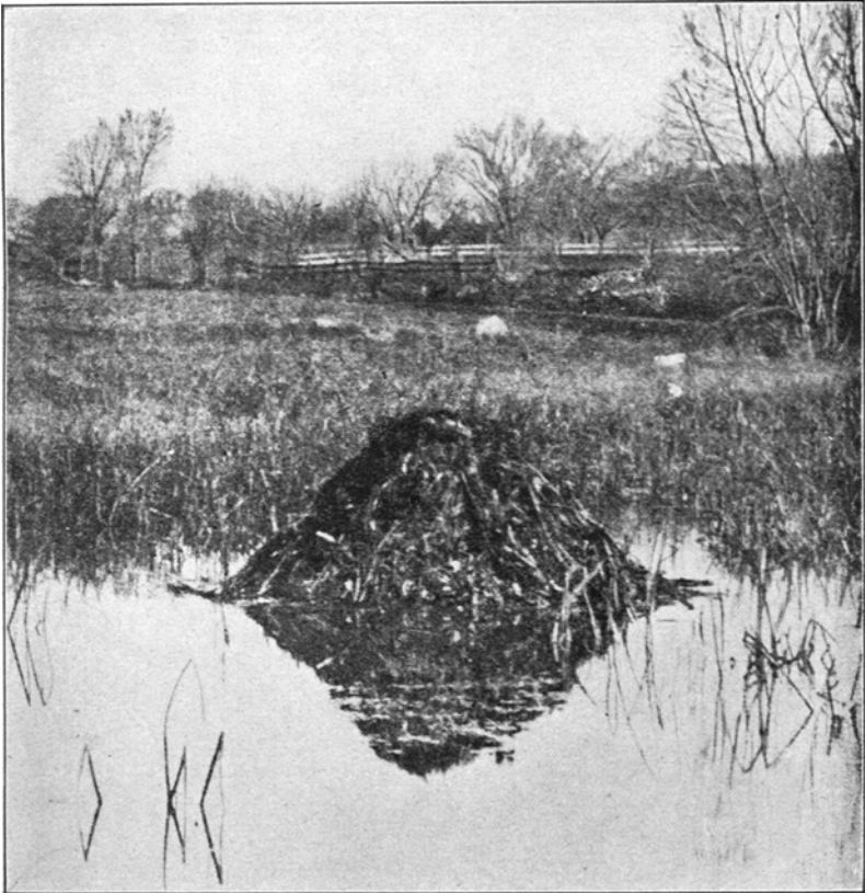
Woning van de muskusrat in de Concord River, Mass. (overgenomen uit het werk van LANTZ).