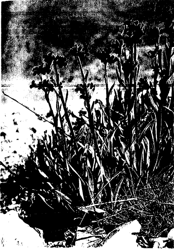
Fig. 1 Mattiastrum nigrum H. Riedl - Wdb. 5430