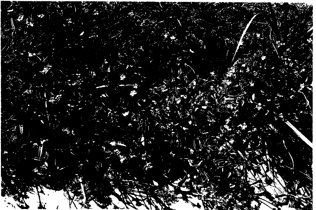
Fig. 2 Mattiastrum formosum Rech. f. et H. Riedl - Rech. 31422