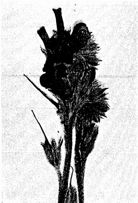
Fig. 159. Mattiastrum Dielsii (MANGER).

num, SW von Kabul (V. 2075). Kabul (L. 57). Babur-Berg bei Kabul (MANGER). — NE: Panjshir, 2000 m (K. 3990).