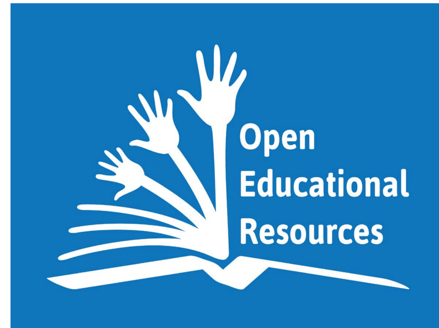
OER Global Logo by Jonathas Mello is licensed under a Creative Commons Attribution Unported 3.0 License

L3T, das „Lehrbuch für Lernen und Lehren mit Technologien“, ist in Deutschland eines der bekanntesten offenen Bildungsressourcen: l3t.eu