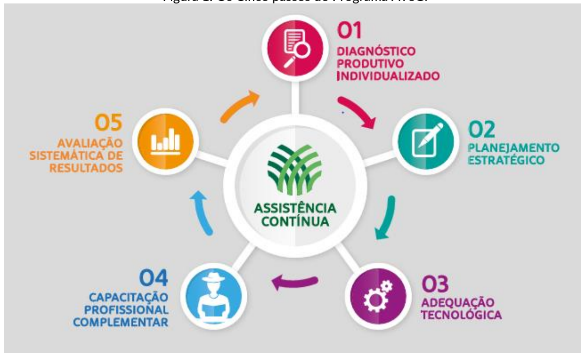
Figura 1: Os Cinco passos do Programa ATeG.

O método de atendimento do programa ATeG passa por cinco etapas e é identificado como os 5 passos do programa ATeG, conforme Figura 1.